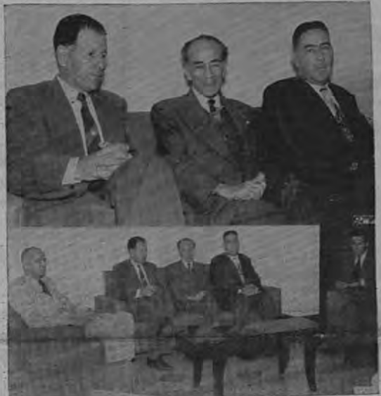
En su visita de ayer tarde al Supremo Tribunal de Elecciones, el Ministro de Seguridad Pública, Coronel Domingo García se entrevistó con los miembros del citado alto organismo para poner a sus órdenes a la Fuerza Pública a efecto de garantizar el normal desarrollo del proceso electoral, conforme lo prescribe la Constitución. Las fotos de BDA muestran, arriba, el Coronel García en compañía de los magistrados Sres. Orosco y Guardia. Abajo, los mismos y al Coronel Guillermo Salazar.