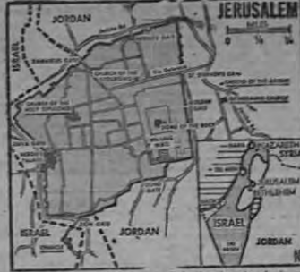
Este mapa de Jerusalén, y el de Palestina incluido al pie, muestran los Santos Lugares y las líneas de partición que los separan desde 1948...