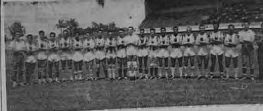
Los blanquinegros del Club Sport La Libertad esperarán la visita del Cartaginés, para cotejarse hoy a las 10 de la mañana en el Estadio Nacional. Los liberos sufrirán la ausencia de varios titulares, por encontrarse lesionados. Pero cuentan con un grupo de novatos de promesa que sabrán llenar los campos de los titulares, porque les sobra empuje y entusiasmo.