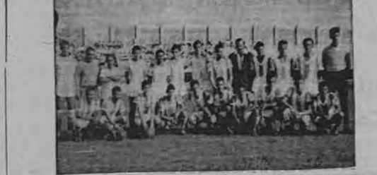
La escuadra cartaginés dirigida por Fello Meza viene al Estadio Nacional en busca de los dos puntos. El equipo brumoso sorprendió a la afición con su desempeño en el campeonato relámpago, y tanto dirigentes como aficionados esperan mucho rendimiento del cuadro blanquinegro.