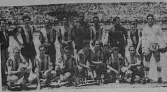
Los uruguayos siempre levantan un rendimiento cuando juegan en el Estadio de Alajuela. De ahí que los mandos se han preparado debidamente para recibir a su visita. El duelo balompédico está señalado para las tres de la tarde en el reducto alajuelense.