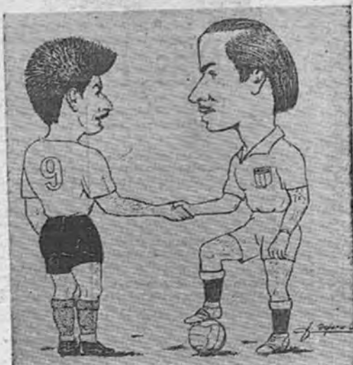
—Cuty a Calderón de la Barca: "En San Salvador nos veremos de nuevo".

mejor anotador habiendo logrado encestar en 9 partidos 122 puntos.