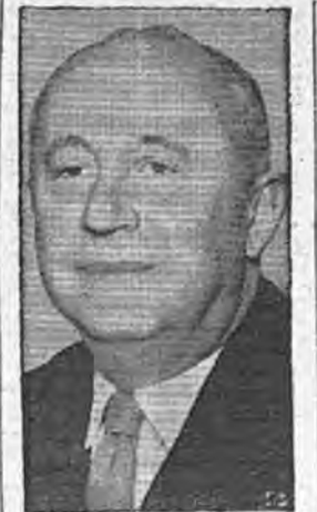
CHRISTIN DIOR, Arbitro indiscutible de la moda falleció a la edad de 52 años en Montecatini, Italia.