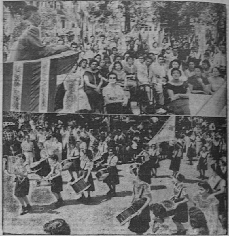
En el Parque Morazán se levantó una tribuna desde la que hablaron varios funcionarios públicos. En primer término aparece el gobernador de la Provincia, don Fernando Rudin, haciendo una cita de los actos de la Independencia.