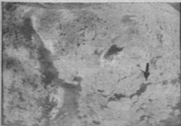
Esta fotografía tomada por nuestro Jefe de Redacción desde la cabina de la TI-227 señala la zona en que cayó parte de la avioneta desintegrada. En el fondo superior de la imagen del río se ven selvas a la izquierda los expedicionarios. Algunos se juegan al agua para hacerse notar mejor. (Foto de Ventura Cordero).