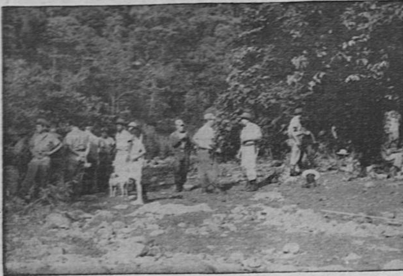
Esta magnífica fotografía tomada por Hugo Araya fue la primera que se publicó ayer en la primera página de LA HORA, sobre el grupo de expedicionarios acampados en un playón del río Peje, en donde permanecen mientras se realizan las búsquedas de la aeronave y sus víctimas.

Primera fotografía publicada en el playón del río Peje