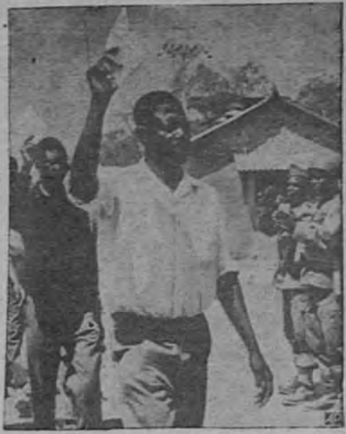
Voluntarios para el ejército de Albert Kalonji, Presidente interino del "Estado Minero" secesionista Kasai Oriental en El Congo muestran sus papeles de ingreso al llegar para ser entrenados al Campo-Simonet, cerca de Elizabethville. Entrenados para el ejército (derecha) dan bienvenida a los recién llegados, haciendo palmas —.