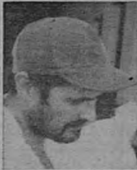
Así como la presunta matadora. Y vienen detalles interesantes.