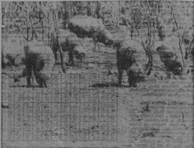
SEQUIA SERA SENTIDA EN LOS SUPER MERCADOS — Ovejas cubiertas de lana encuentran dificultoso el encontrar suficiente pasto para su sustento en San Angelo, Texas, mientras una sequía de 7 meses de duración ha convertido los llanos del Sureste en un tazón de polvo. Los pastos se están secando en Oklahoma, Texas, Nuevo México y Colorado, y los efectos serán sentidos muy pronto en los super mercados de toda la nación, según dicen observadores.

En el futuro —dijo— la principal concentración se destinaría a países productores de drogas primarias, como Tailandia, Irán, Turquía y Birmania.