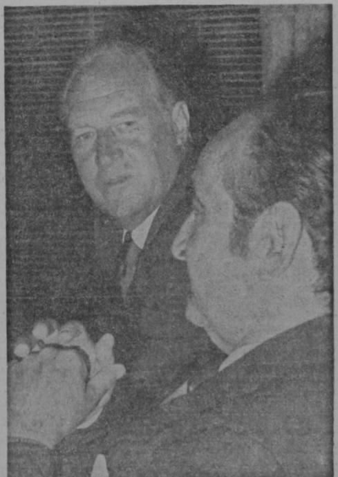
El Secretario de Estado, señor Rogers, en el momento de su entrevista con el Presidente Figueres minutos después de haber arribado a Costa Rica. La entrevista se prolongó una hora.

de estrecha asociación". El Secretario de Estado norteamericano declaró que su país continuará ofreciendo su asistencia activa al sistema interamericano. (Texto en página 6)