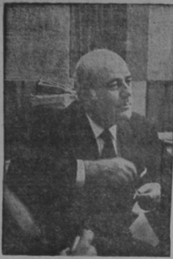
DON MARIO ECHANDI