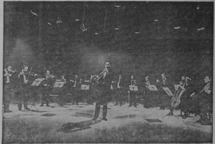
En la gráfica aparece la Camerata Bariloche, grupo musical de cuerdas que el próximo 19 de mayo entrará a actuar en el Museo Nacional. La Camerata Bariloche es argentina. Ha actuado en prestigiosos centros de música clásica.

lón. "Los Sorpresivos" es un grupo integrado por limonenses y panameños. "Costa Rica Swing" fue grabado por la disquera nacional.