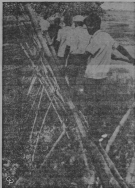
NATIVOS TAMBIEN HUYEN DE PAQUISTAN ESTE — No solamente los extranjeros están saliendo del combatiendo Paquistán Este, sino también los nativos, como es testificado por esta foto de nativos de Paquistán Este cruzando por un puente de bambú dentro de la India.

Los presos de Turín demandan desde hace dos años urgentes reformas a los sistemas jurídico y penal italiano. Hace casi exactamente dos años ocuparon la prisión en un motín similar y se mantuvieron firmes por espacio de tres días hasta que 1.000 policías los derrotaron.