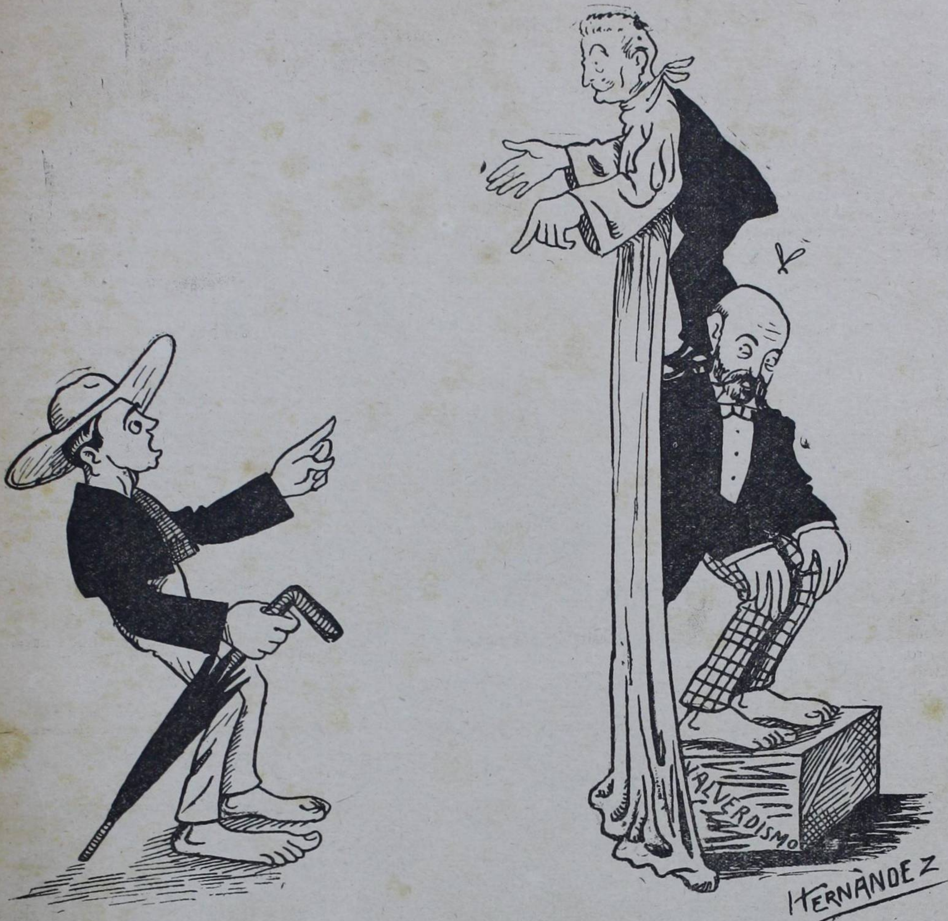
EL CONCHO.—Carachas, cómo ha crecido en mes y medio el Dautor. Pa yo que debe tener cosa mala por detrás.