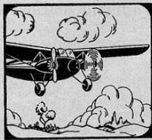
Los Bimotors «Kingbird» pueden volar con un solo motor en caso de emergencia.