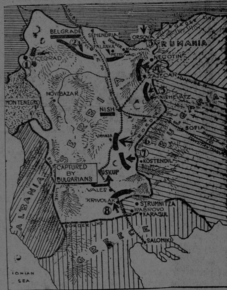
Mapa que muestra el teatro de las operaciones en los Balkanes

Porque no estamos dormidos sobre nuestras primeras victorias; seguimos muy de cerca el rastro del enemigo que nos ataca en la sombra.