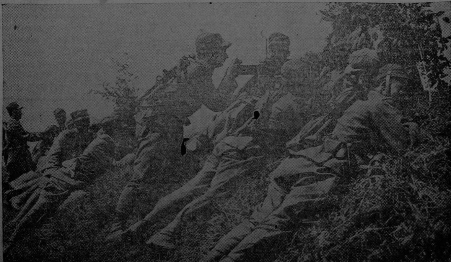
Soldados italianos manejando una ametralladora contra los austriacos en los Alpes Cárnicos