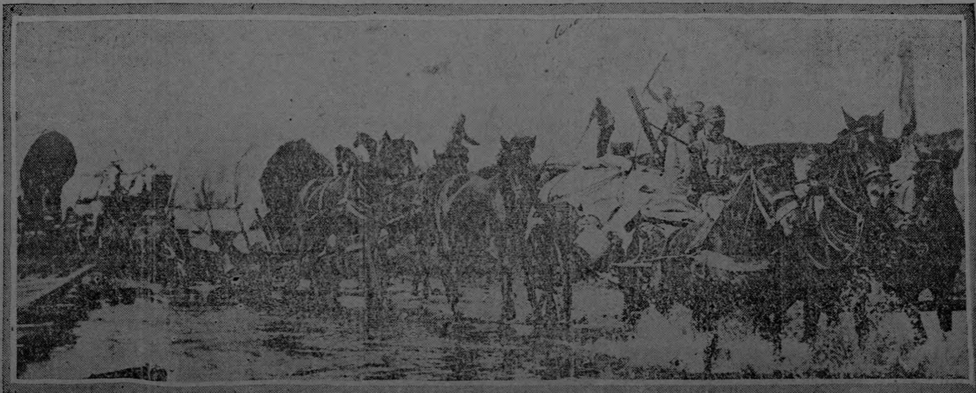
AUSTRIANS ADVANCING ON BREST-LITOVSK — © INTERNATIONAL FILM SERVICE.

Santa Ana.—Por telégrafo. Con toda tranquilidad y en la más completa libertad vota este pueblo unánimemente por la papeleta del Partido Republicano. Los pocos del bando fusionado ante la actitud del pueblo santaneco que lo es compacto gobiernista se encuentran cabizbajo en espera de la sentencia que les quite el velo que en mala hora les puso el Doctor Durán y don Rafael Yglesias. El lunes, cuando todo haya terminado, debemos unirnos como hermanos que somos y ayudar a la gran obra regeneradora que se ha comprometido el Gobierno con toda la República que de corazón lo apoyamos. Hagámos República, costarricenses honrados.