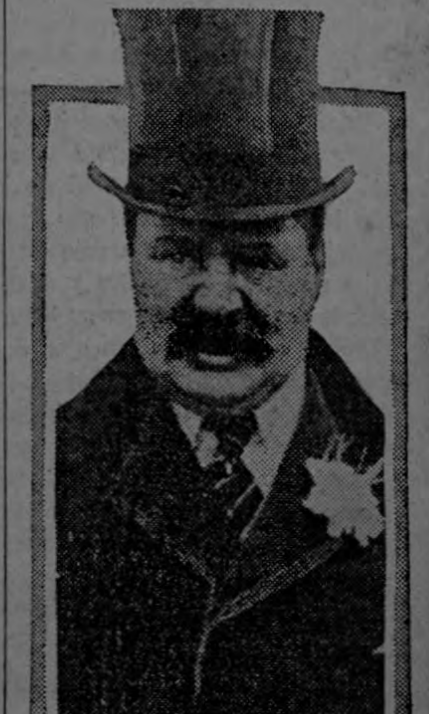
EARL OF DERBY CONSCRIPCION PARCIAL EN INGLATERRA

En Honduras hay la creencia de que cuando aparecen esos enormes ejemplares, es señal inequívoca de que la plaga va a terminar.