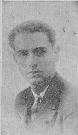
GILBERTO MURILLO Célebre compositor costarricense

Este viejo que aquí está pintado, es el gran compositor costarricense que ha obtenido enormes triunfos y que cosechará más y más si sigue el camino del arte de Bethoven.