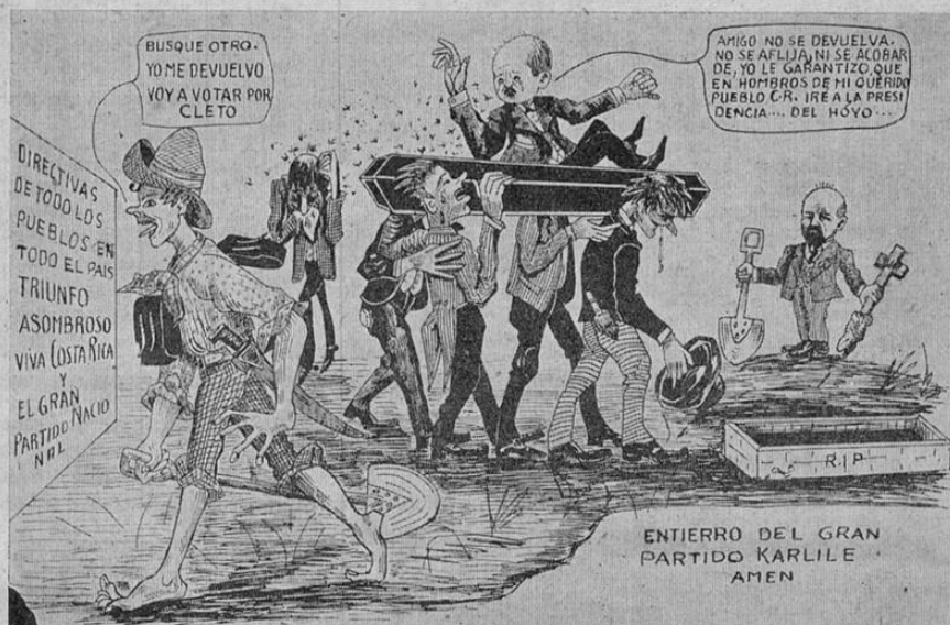
Entierro del gran Partido Karlista