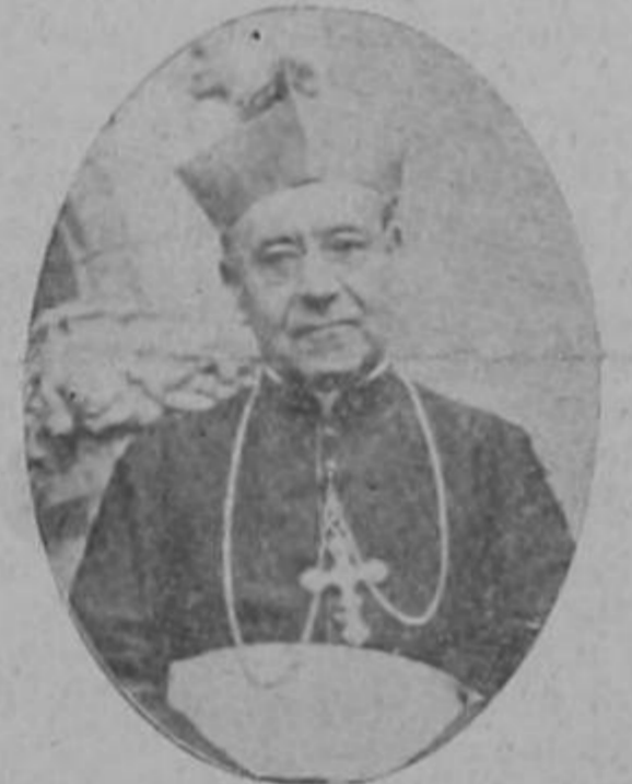
Mons. Leopoldo Ruiz y Flores

«En lo que concierne a la intervención del gobierno americano, le dice al Presi-