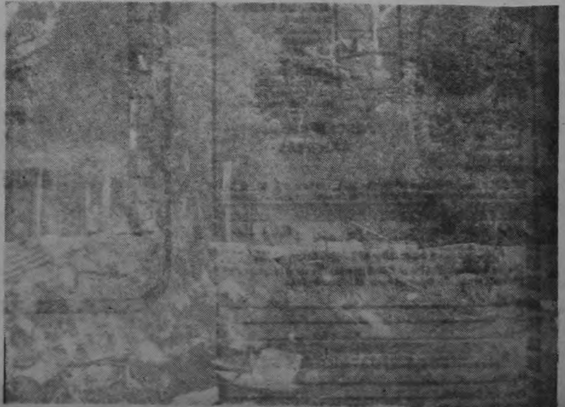
Aquí —en el centro de Golfito— existían horribles tugurios, que en colaboración mutua entre Municipalidad y el INVU se destruyeron para darle en una zona más sana, alojamiento a