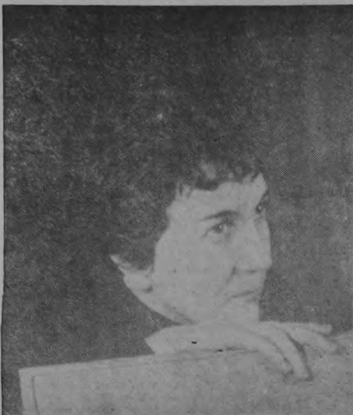
Ana Poltronieri, la gran actriz dramática de Costa Rica, que ensaya "LA VISITA", con Daniel Gallegos de director.