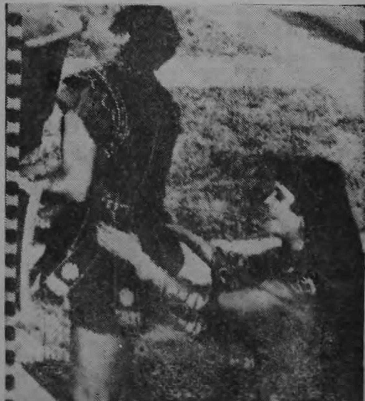
TORRE ASTURA Italia: Como el actor Richard Burton se prepara para una batalla con su hijo, y la actriz Elizabeth Taylor se hace esquiños en el set de la película "Cleopatra". Más tarde Burton y la señora Taylor empezaron una pelea en el set.