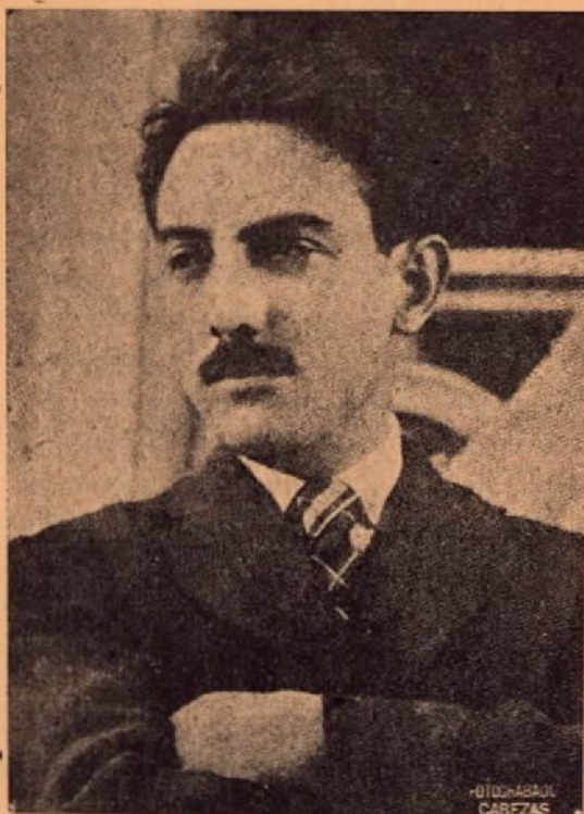
Don Omar Dengo