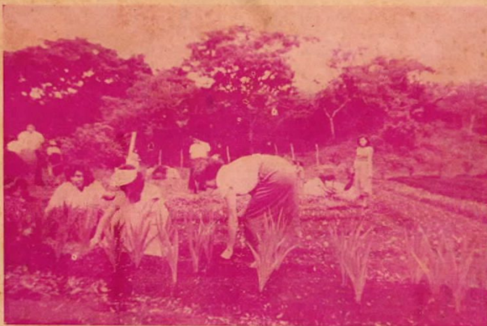
Alumnas trabajando el jardín