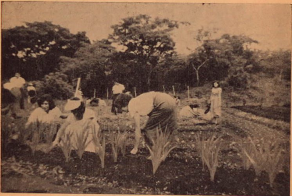
Alumnas trabajando en el jardín.