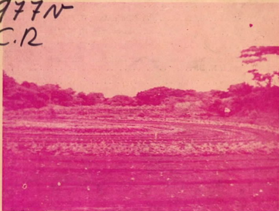
Un aspecto del campo de agricultura de la Escuela Normal de C. R.