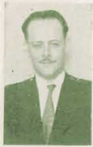
EFRAIM MONGE BERMUDEZ ex-Jefe Administrativo de Educación Primaria, hoy Diputado al Congreso Constitucional.

Economizar en escuelas es regatear cultura al pueblo y eso no lo ha considerado siquiera el actual Gobierno