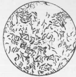
Spirillum cholerae asiaticæ Koch, el microbio del cólera, aumentado 1000 veces. Muestra las células con forma de una coma dispersas (grabado según microfotografía de Migula).

dios el descubrimiento de una bacteria característica que se encontró en los intestinos de los coléricos y una vez en un charco de un distrito infestado. Esta bacteria fué llamada Spirillum cholerae asiaticæ Koch, y se le llama también Bacillus comma , á causa de su forma parecida á la de una coma (véase el grabado primero).