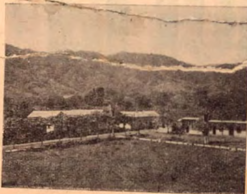
El legendario cerro de Las Cruces en Nicoya