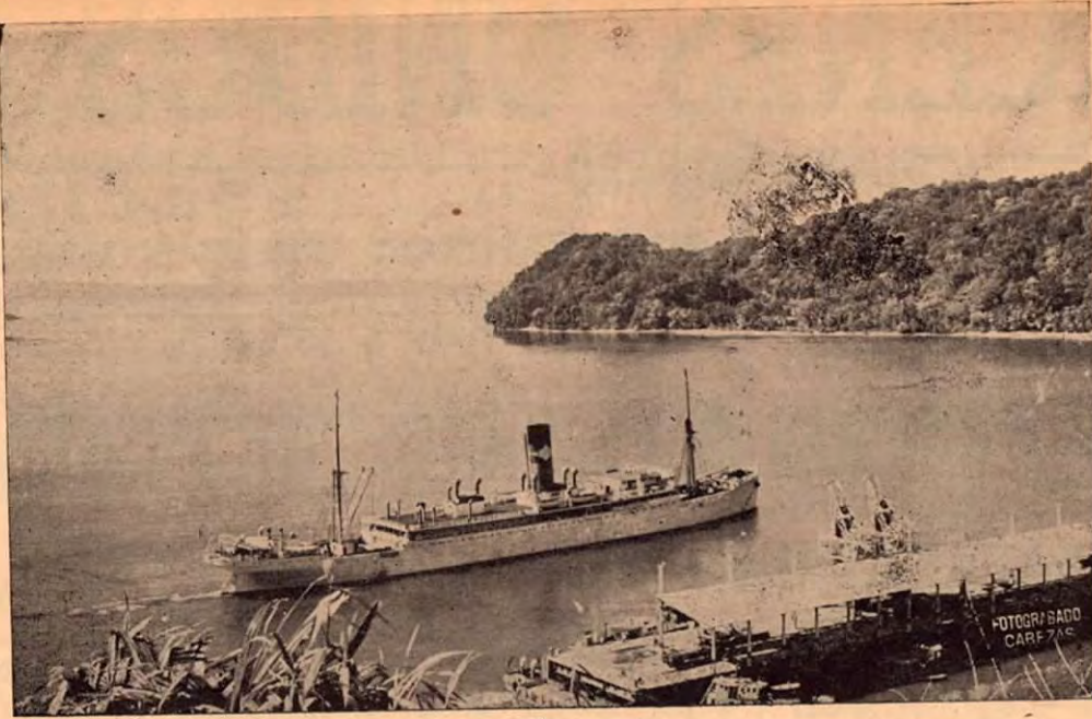
Muestra esta bella composición fotográfica, todo el realismo y el esplendor de la bahía de Golfito. Por este puertecito de nuestra región Sur, sale la producción bananera hacia los mercados extranjeros, especialmente a los de Estados Unidos.