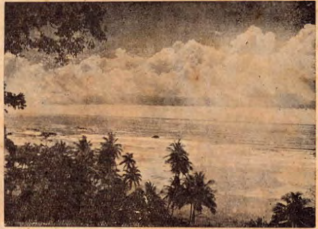
La pintoresca Bahía del Coco en Guanacaste.