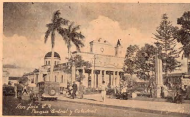
Parque Central y Catedral, San José.