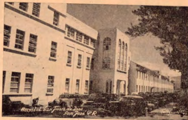
Hospital San Juan de Dios, San José.