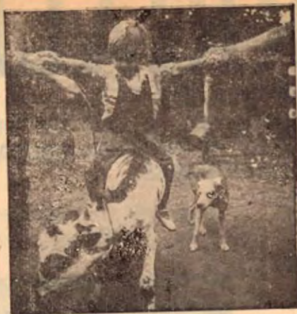
Un pequeño montador de toros