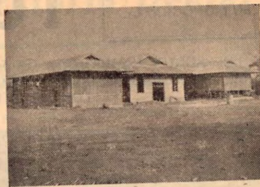
Escuela "Doris de Stone" de Quepos