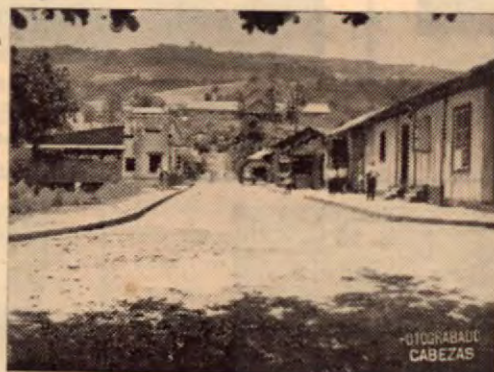
Una de las bonitas calles de Turrialba

En nuestro número anterior llevamos a conocimiento de nuestros lectores unos cuantos apuntes históricos sobre Turrialba, datos e informes que de algún provecho habrán de ser cuando se haga su monografía.