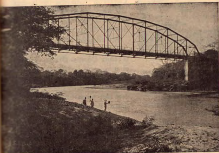
Magnífico puente sobre el río Tempisque, obra del ex-Presidente Jiménez Oreamuno.