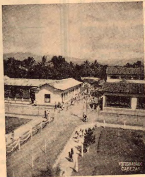
Interesante aspecto de una calle en Esparta

Durante la Administración del Presidente don Tomás Guardia, se substituyó el nombre de Esparza por el de Esparta a solicitud de algunos vecinos.