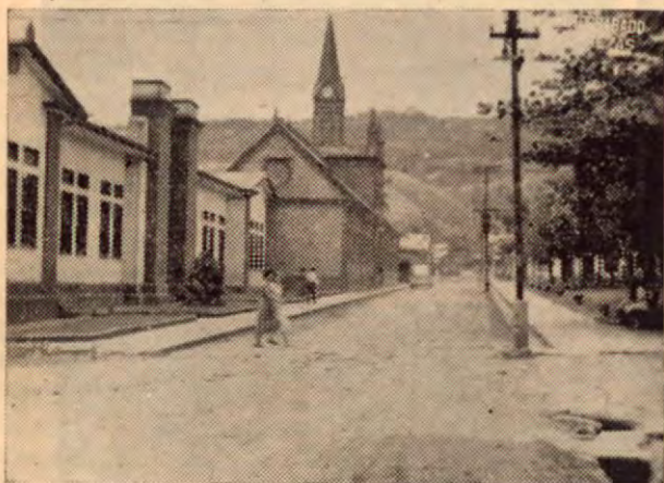
Un aspecto interesante de la calle, la Escuela y la Iglesia en Turrialba.

EN 1835, SEGUN UN PADRON DE LA EPOCA, EL VALLE DE TURRIALBA TENIA: "74 ALMAS DE UNO Y OTRO SEXO Y 150 PEONES".-DOCUMENTO DE LOS ARCHIVOS NACIONALES.