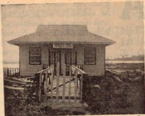
Vieja casa de Quepos que estuvo sirviendo de Iglesia a los "Testigos de Jehová". Hoy está desocupada debido a su estado ruinoso.