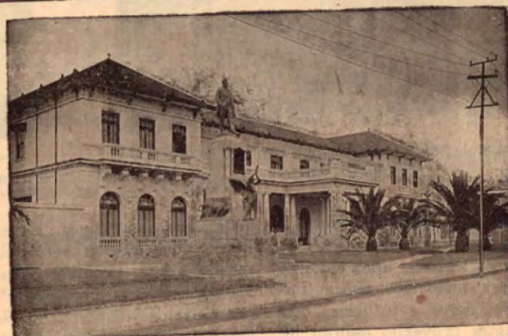
El Club Unión de San José, sitio de reunión de la más selecta sociedad del país, y donde se celebran las más brillantes fiestas sociales de la capital.