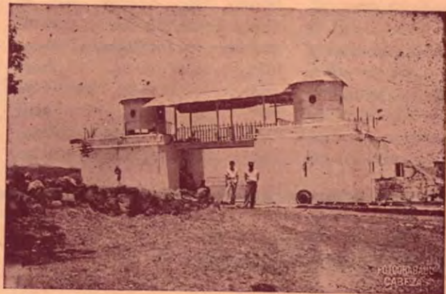
Presidio de San Lucas.