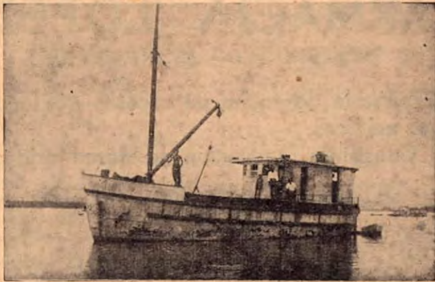
Lancha LA GAVIOTA