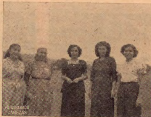
Grupo de Maestras del curso lectivo de 1951.

Su comunicación más importante con el resto del país es aérea, pues como dijimos antes, es un pueblo sin caminos y dejado de la mano de los gobiernos. Tuvimos una reunión cívica con sus principa-