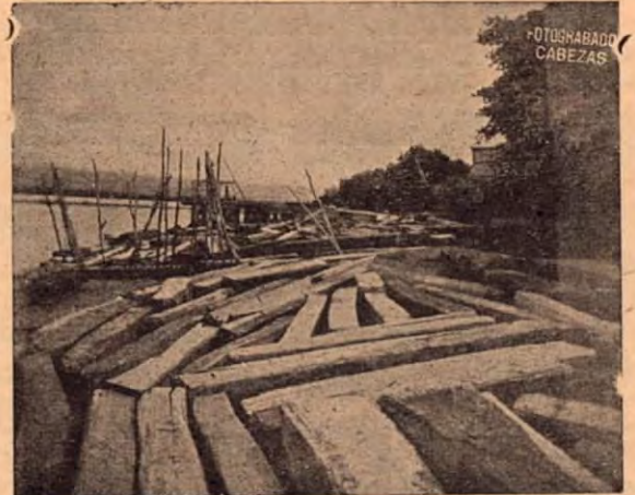
Madera en el puertecito de embarque

Una empresa al servicio del desarrollo industrial de la madera en Costa Rica