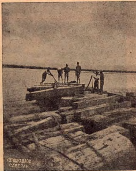
Amarre de la madera en el río

Nuestras maderas son distribuidas por las casas más serias en el ramo en SAN JOSE, como el