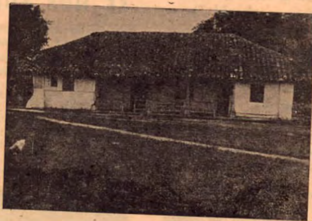
Casa histórica donde nació en Bagaces don Tomás Guardia.

Período histórico al cual el distinguido Estadista lega su nombre, como el gran Patriota lega también su memoria a sus conciudadanos".