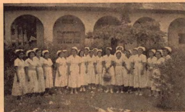
Numerozo grupo de enfermeras atienden con abnegación y diligencia los servicios del hospital.