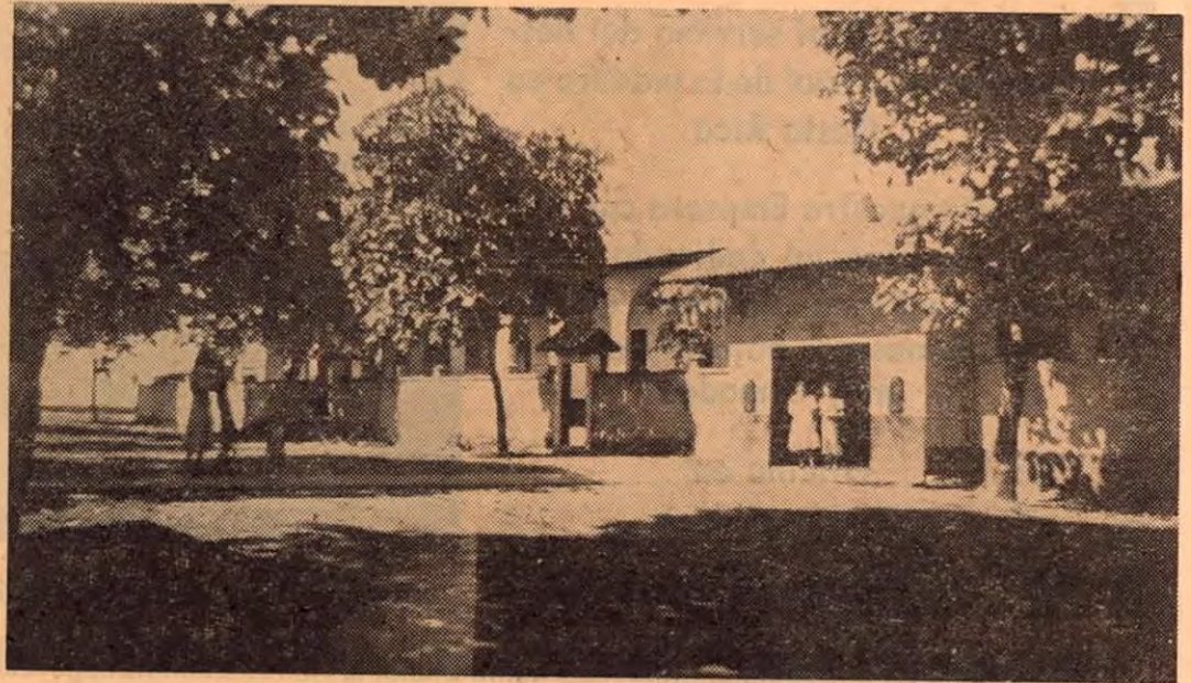
EL HOSPITAL "SAN RAFAEL" DE PUNTAERNAS

Las rentas para su sostenimiento fueron el producto íntegro de las