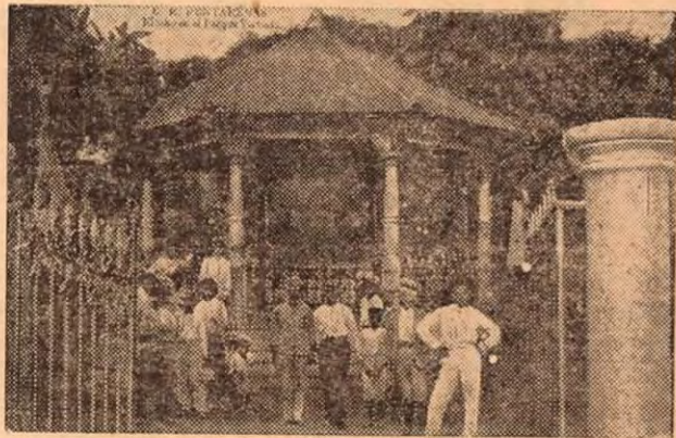
Kiosco del antiguo Parque Victoria en 1910.