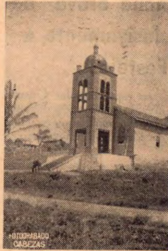
La Iglesia del pueblo de Los Angeles de Tilarán