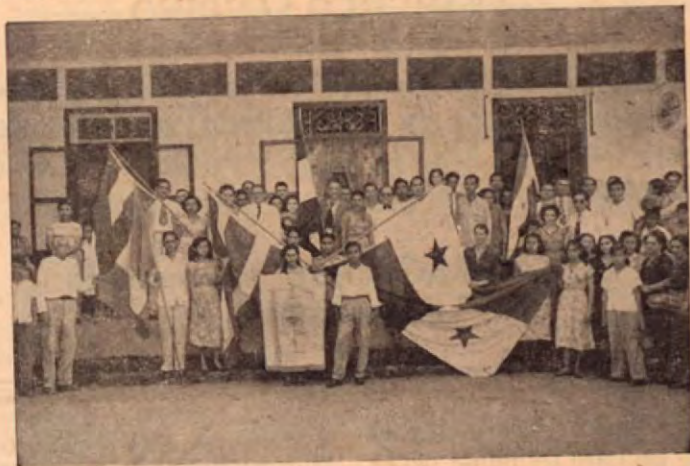
Los excursionistas golfiteños frente al Consulado de Costa Rica en David, Chiriquí, República de Panamá. Posaron para Foto Barú al regresar de la visita que le hicieran a la casa donde vivió el General Morazán. Los acompañan las autoridades locales y varios miembros de la Confederación Centroamericana de David.

EL CENTRO DE AMIGOS DE GOLFITO EN DAVID, CHIRIQUI