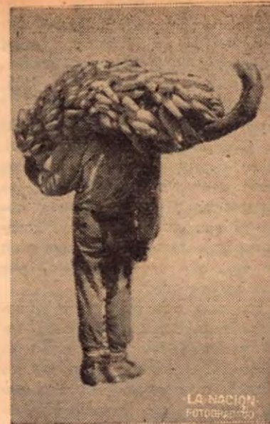
El conchero de los muelles de la Zona Bananera.

Después de terminar sus labores reciben su paga y es entonces cuando se les ve recobrar su libre aldrío, es en ellos como un recobrar de la vida; cada uno, coge su plata y como si explotaran después de estar comprimida su libertad, manifiestan su temperamento en lo que vale: Unos juran y maldicen a sus Jefes o Capataces; otros rezongan y reniegan de su suerte; otros aunque molidos, se manifiestan alegres por haber recibido dinero con que pagar sus deudas y con que satisfacer sus apetitos. Pero la mayoría de