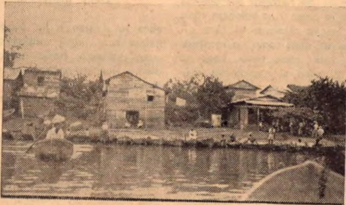
El Río Térraba. Aspecto del pobla- do en la ribera.

Por eso los cargadores son a pesar de su aspecto de hombres sin vida, la vida misma del "Car- guío". Cuando vendrá barco... y vino barco, son las exclamaciones que llenan las bocas de los traba- jadores de este pequeño Puerto,