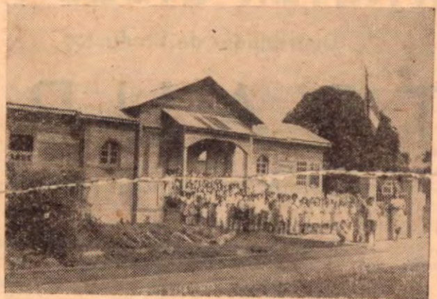
Celebración de la fiesta patria en la Escuela de Puerto Cortés. Aspecto tomado en 1949.

Desea a su muy distinguida clientela, GRA- TAS NAVIDADES Y UN PROSPERO AÑO NUEVO.