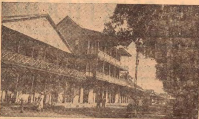
Vieja calle de Puerto Limón. Foto tomada en 1928.

Y que si he de morir, sea en el cobalto profundo de los cielos, y tan alto que a la tierra jamás lleguen mis plumas..!