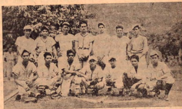
Los peloteros de QUEPOS posan para nosotros antes del partido con el UNIFRUITCO