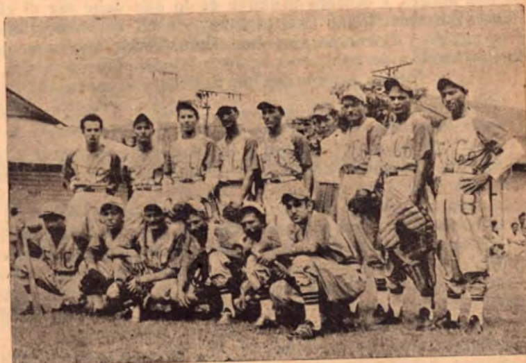
Los muchachos del UNIFRUITCO (UF-CO) que presentaron una resistencia victoriosa a los de QUEPOS