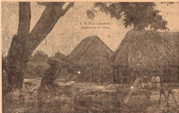
Una de las actividades de más rendimiento en el viejo rancharío y cercas de tierra, que era Puntarenas de fines de siglo pasado, era la construcción de botes y embarcaciones.