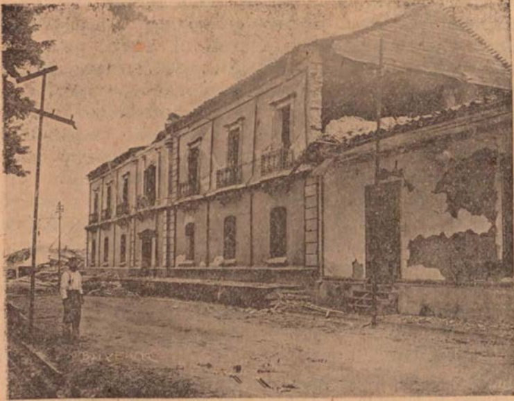
Edificio Municipal de Cartago, después del terremoto. En sus salones tuvo lugar la instalación de la Corte de Paz Centroamericana.