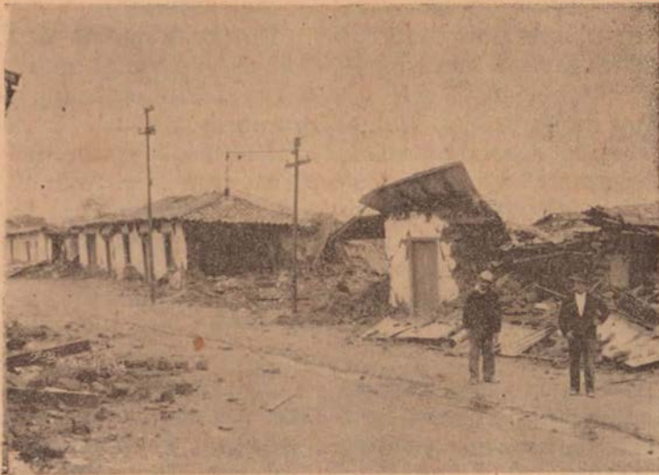
Estado de los edificios que quedaron mejor en Cartago después del terremoto.