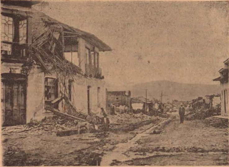
Una de las principales calles de la ciudad al amanecer el 5 de mayo