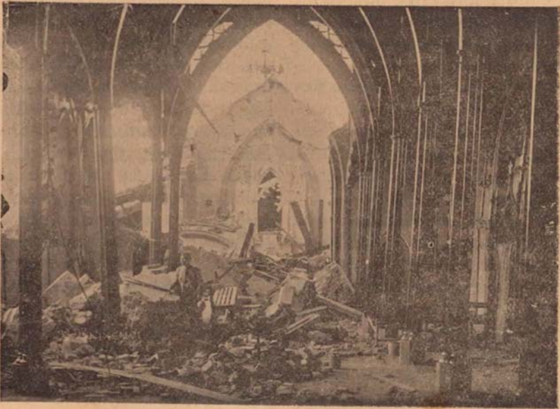
Capilla de Salesianos, al amanecer el 5 de mayo.

De los escombros se sacaron dos cuerpos de dos hermanos de la Institución y uno de un huerfanito.—Una parte de la torre de esta capilla fué la que dió muerte al poeta costarricense don Rafael Angel Troyo