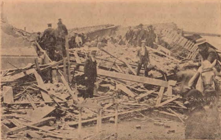
El grupo de gente representa el momento en que sacaron de los escombros el cuerpo de un hombre que se encontró sentado en actitud de escribir.