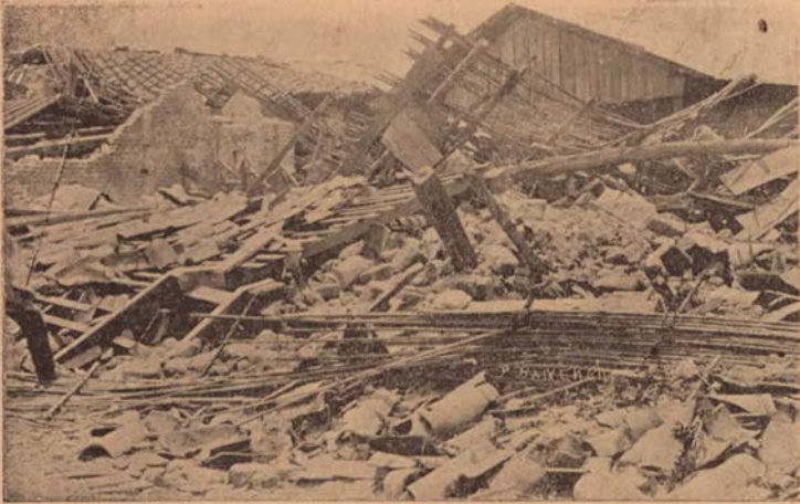
Ruinas en una de las principales calles de la ciudad, causadas por el terremoto del 4 de mayo de 1910