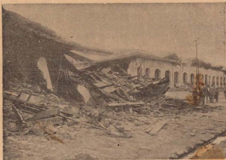
Ruinas del Mercado de Cartago