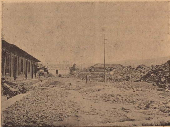
Aspecto de la calle de los Angeles, después del terremoto del 4 de mayo