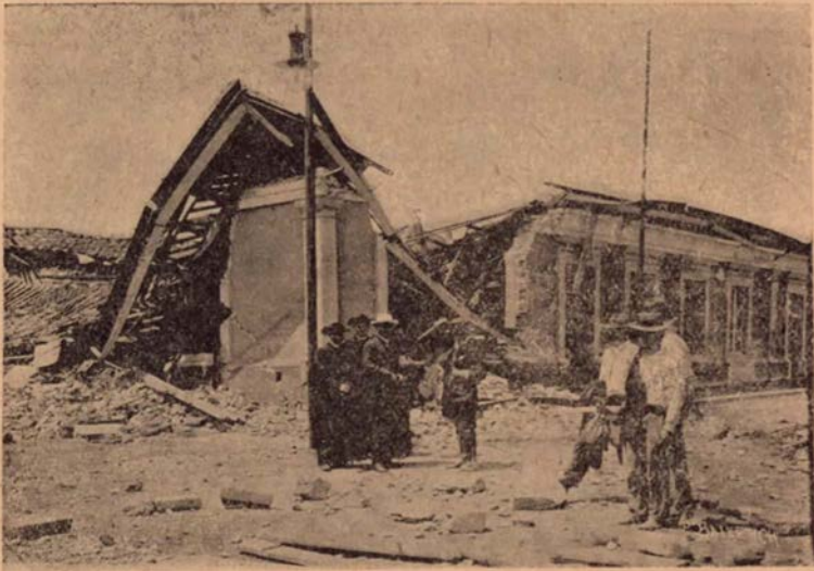
Una de las principales casas de habitación totalmente arruinada por el terremoto