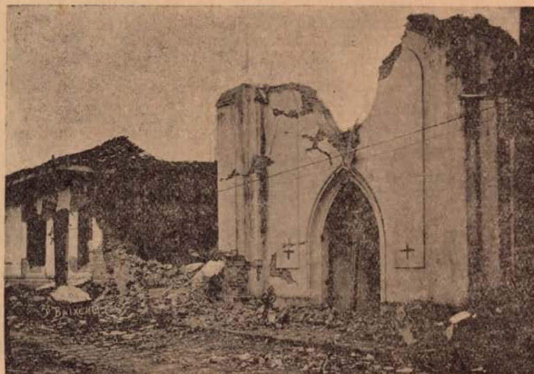
Ruinas del Convento y de una casa particular.