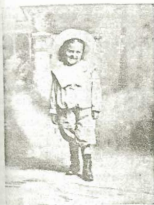
Con este cuerpucillo sandunguero que Dios me dió; con esta sonrisa y estos ojos, y con mi sombrero echado á la pechuga, ¿enal muchacha me dice que no?

¿Quién se había de imaginar que aquel revolucionario de El Gran Galateo , que aquel ardoroso Ministro de la República, con tantos ruidosos triunfos en su carrera literaria y política, resultara un hombre modesto, de poca hablar y de vida tranquila? Es ya un anciano y muy parecido en el perfil de la cara y hasta en el modo de llevar la barba, á don Carlos Holguín. Lo vi en la Academia y en la Sección de Ciencias del Congreso Iberoamericano, siempre sereno y laborioso. Hoy ciertos jóvenes literatos y re-