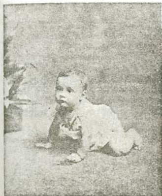
Los primeros pasos en la carrera de la vida son siempre difíciles.

Picón es republicano como el insigne orador.