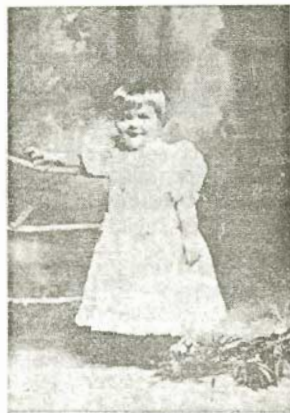
En aquellos momentos el placer se manifestaba en mi semblante .....