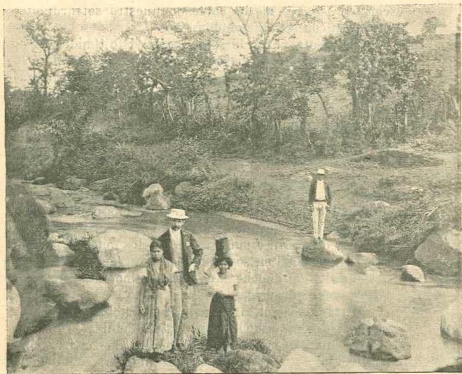
VISTA DEL RÍO TORRES