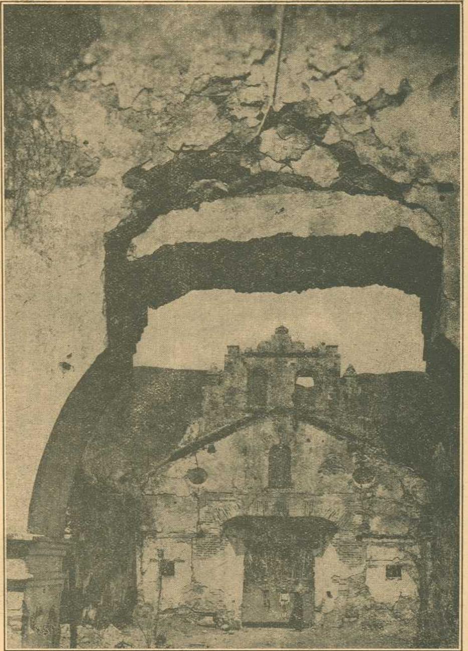
RUINAS DE UJARRAZ