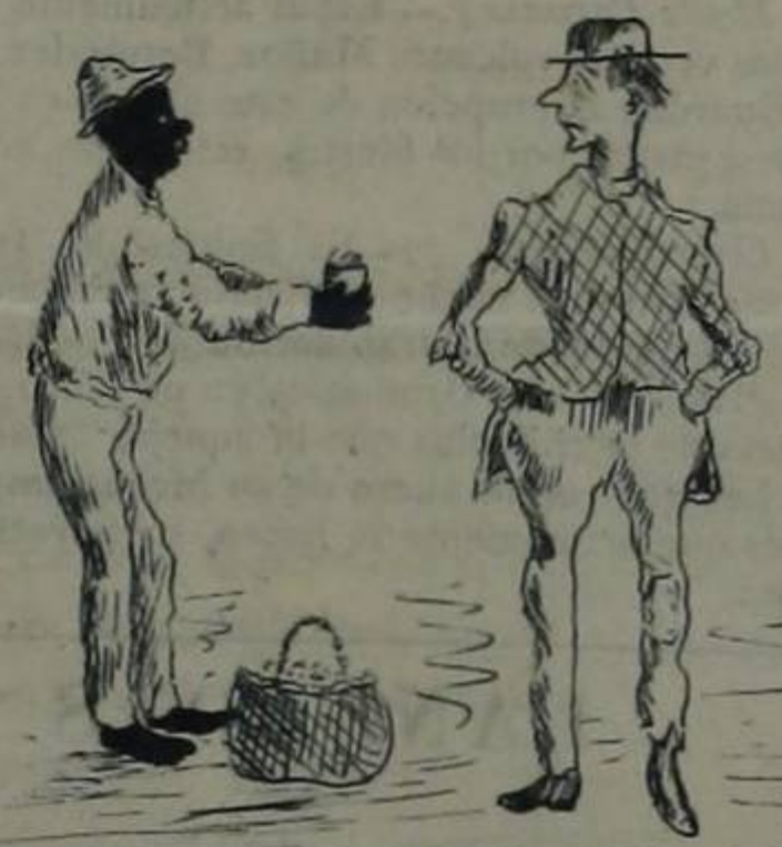
MANÍ, CABALLERO?— -PARA MANI .....PULEO EL DEL GOBIERNO AL CUAL DEBO LA CESANTÍA