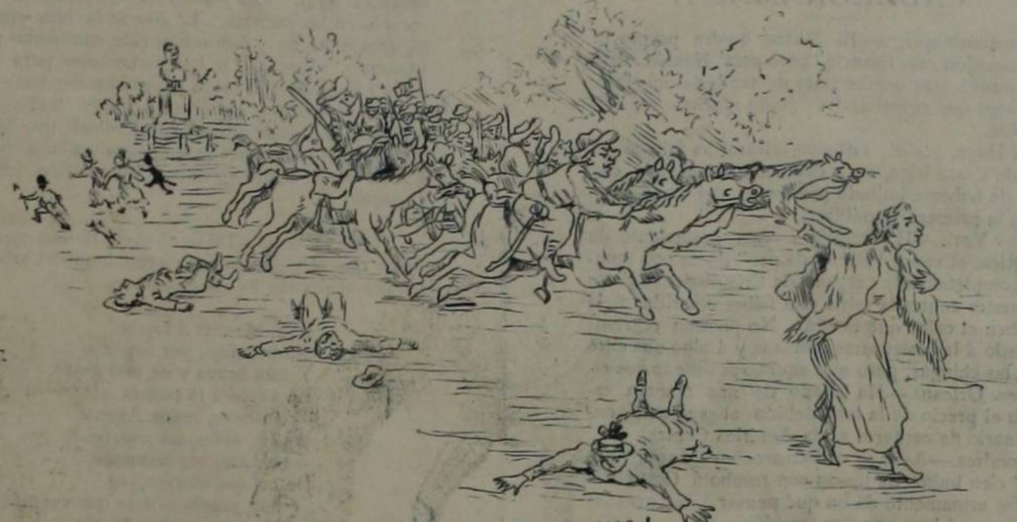
¡SUBLIME MUESTRA DE VALOR!