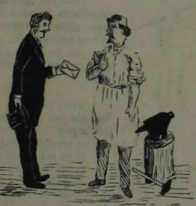
¿ESTA CARTA?—NO ES PARA MÍ, SEÑOR!