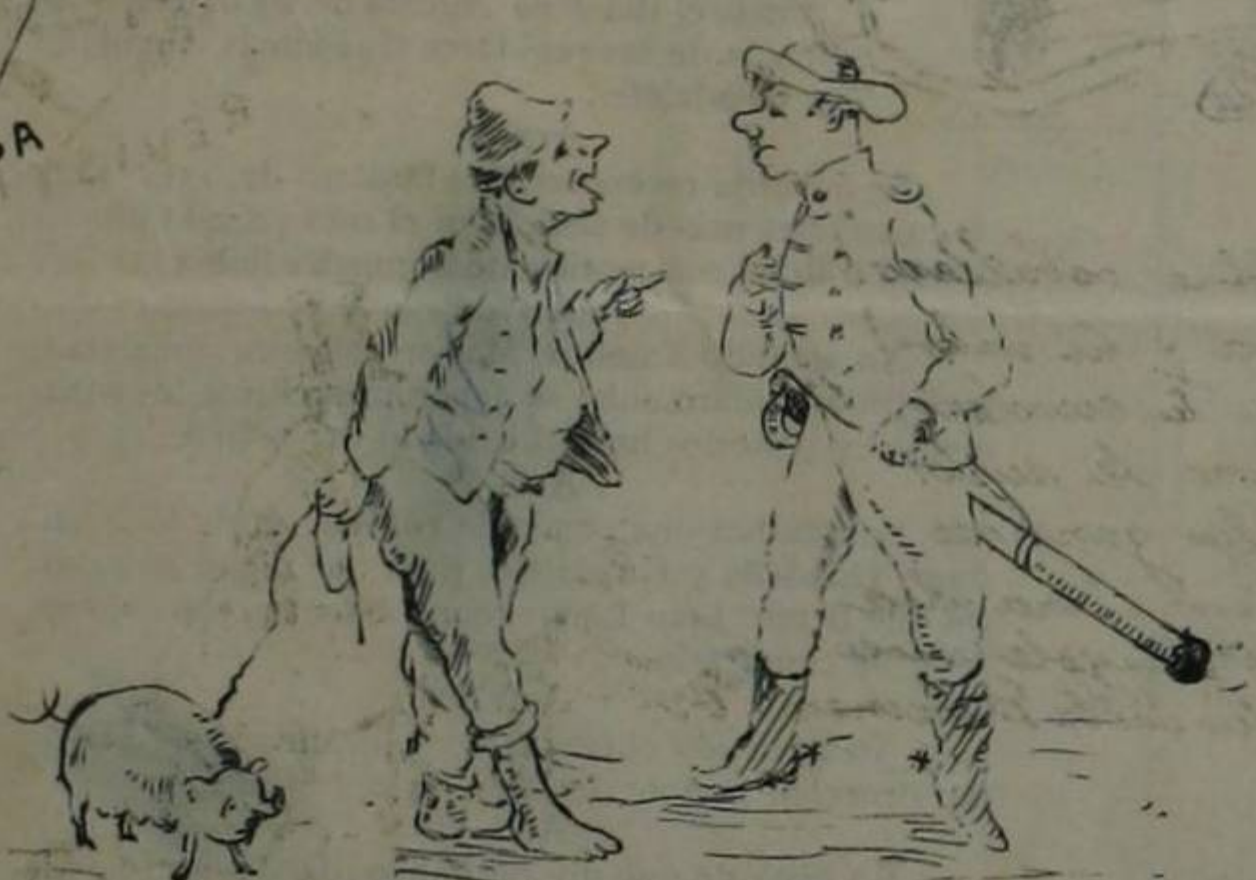
-¿Y LA FAMILIA, CÓMO ESTÁ?—PUS YA LO VES, MAMA MI HA MANDAO Á VENDER ESTE CHANCHO PA HACER UNA VELA DE ANIMAS COM TAL DE QUE NO TE MATEM, DICEM QUE EN LAS ELESIONES