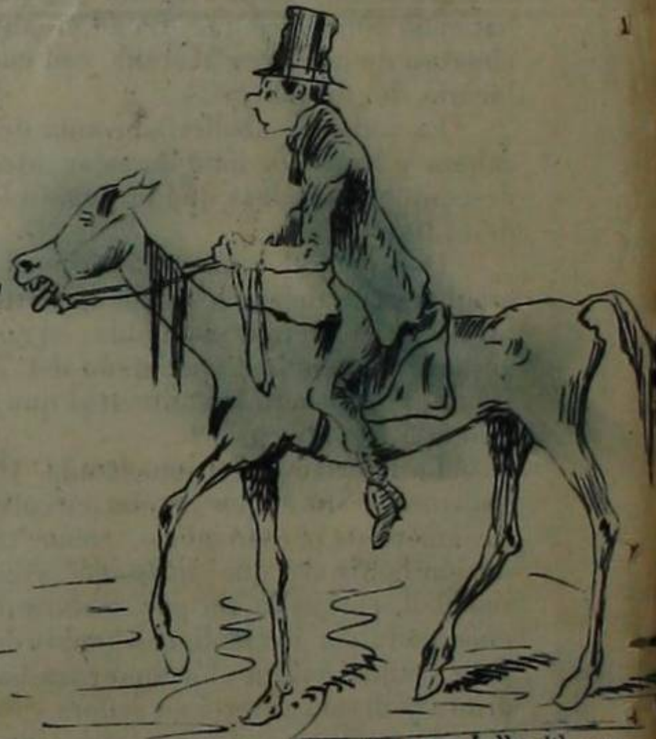
El pais en caballo blanco

Ya estais en el palenque, sublime caballero! Llevando como escudo tu fama y tu valor! Detrás de tu persona cabalga tu escudero Enchudo de ilusiones y lleno de sudor. Oh! andante caballero, fidalgo generoso Tu llevas en la monte bellissima una idea! Lavanla la cabera, porque es Quijote auroso La libertad de un pueblo tu bella Duhinea!