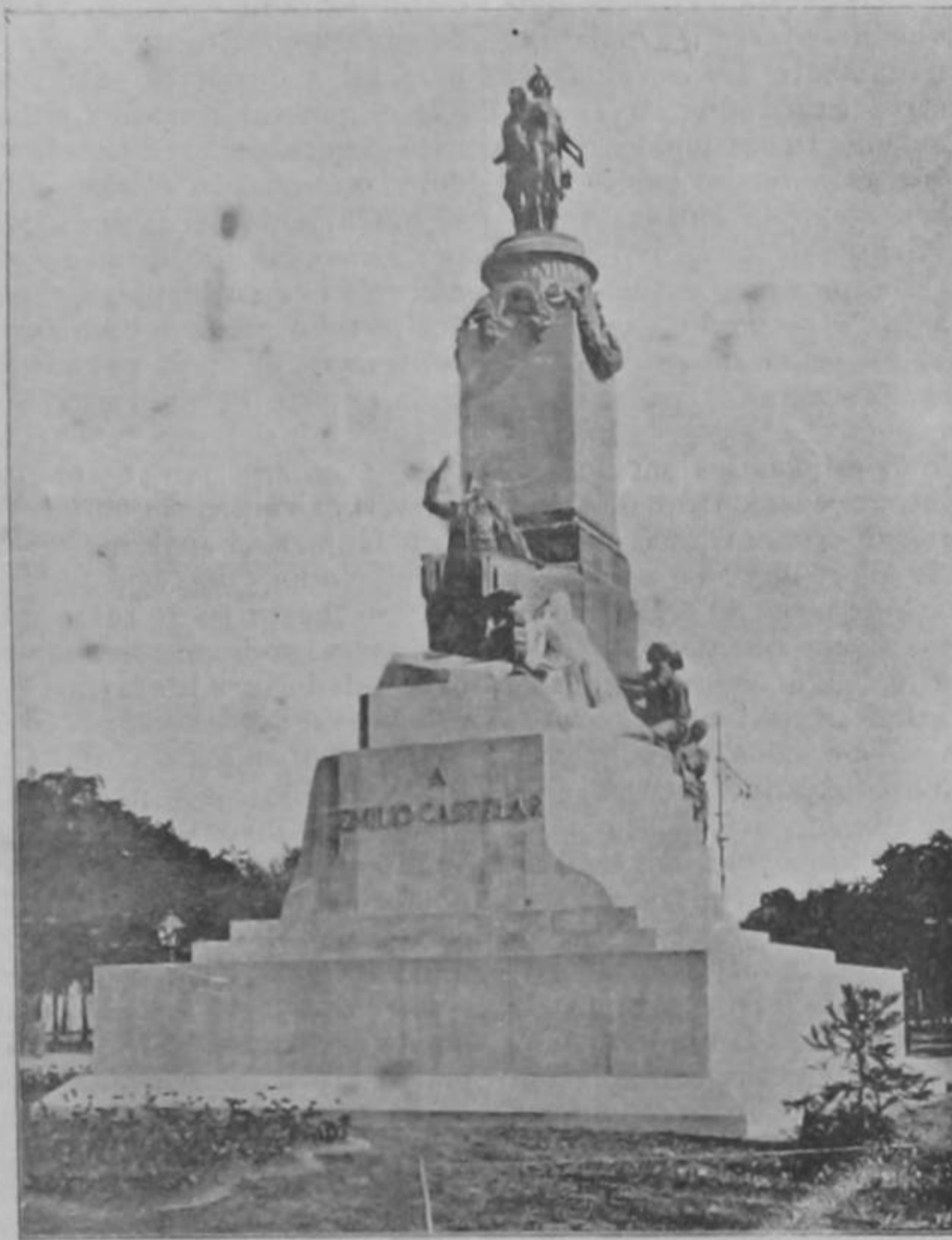
Monumento á don Emilio Cartelar en Madrid

á los del Congreso, puestos diagonalmente; colocada entre ellos, en actitud de hablar, alta la cabeza, extendida la diestra, está la figura de Castelar, también de bronce, parecidísima de rostro y de apostura, y llena de dignidad y nobleza.