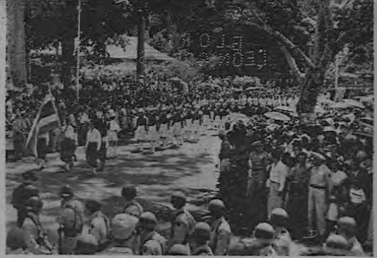
Arriba, hacia el fondo, sobre la multitud, se ve el monumento, severa, simbólica la estatua de mármol y bronce León Cortés. Al centro, aspecto de la muchedumbre. Abajo, momento culminante de la llegada del destile a la plataforma del aeropuerto.