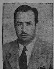
DR. DON MARIANO GULIEN SOLANO

El próximo domingo se verificará la CONVENCION DEL PARTIDO UNION NACIONAL y Costa Rica señalará el próximo presidente de la República SERA EL PUEBLO EL QUE DECIDA LA GRAN CONVENCION DEL PUEBLO!