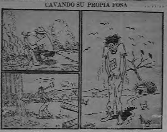
HOY Quemura y desolación MAÑANA Misericordia y desolación