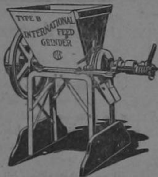
Máquinas para moler maíz