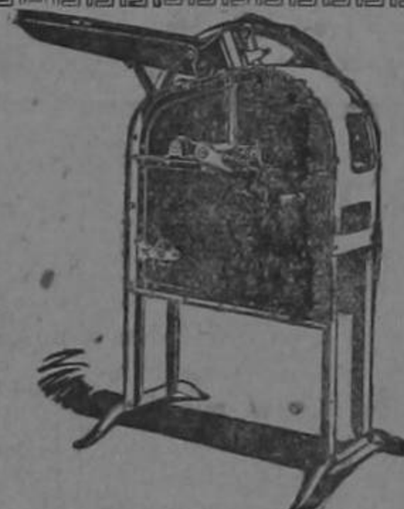
Desgrenadora de maíz (toda de acero)