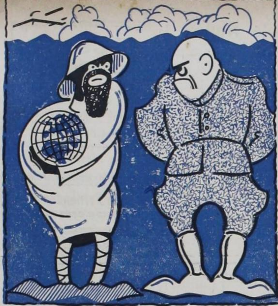
La Cámara de DON LUNES ha captado esta foto de interés histórico. El Amo y caudillo de Italia se ha propuesto ayudar a 1 rebelde General Franco a trasbordar, por medio de aviones, los morenos moros a las costas españolas.