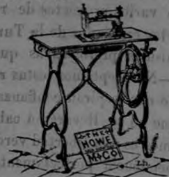
TIPO DE LA Verdadera Elias Howe

Decreto de LONDRES 1862 PARIS 1867 VIENA 1873