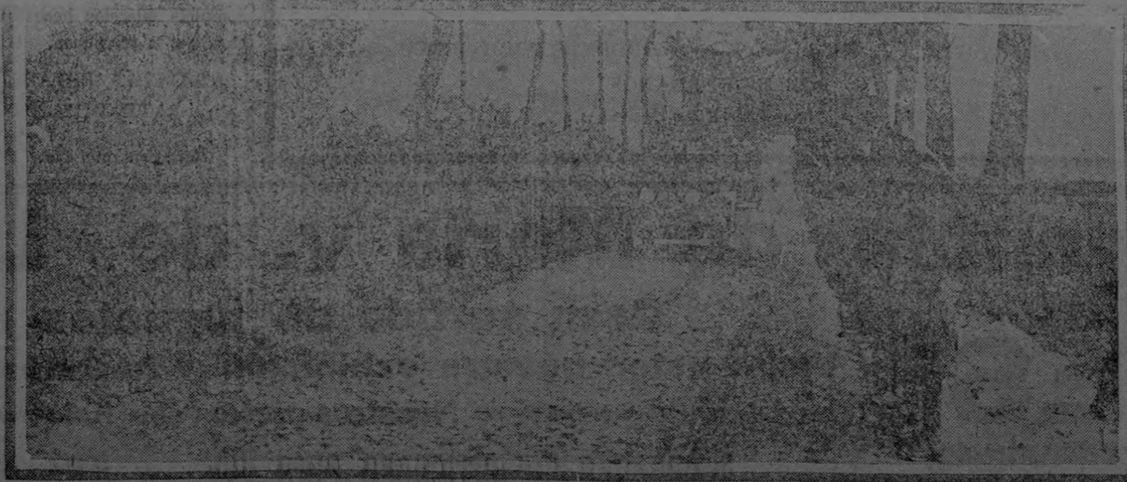
This cut shows King George of England reviewing his troops in Flanders. This photograph was taken just a few minutes before the King met with the accident which befell him some time ago.