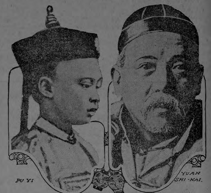
EL EX-EMPERADOR DE CHINA CONTRAERA ESPONSALES CON LA HIJA DE YUAN SHI KAI.

GINEBRA. — Los periódicos dicen que el Gobierno griego ordenó a todos sus súbditos, establecidos en Egipto, que regresen inmediatamente a su patria.