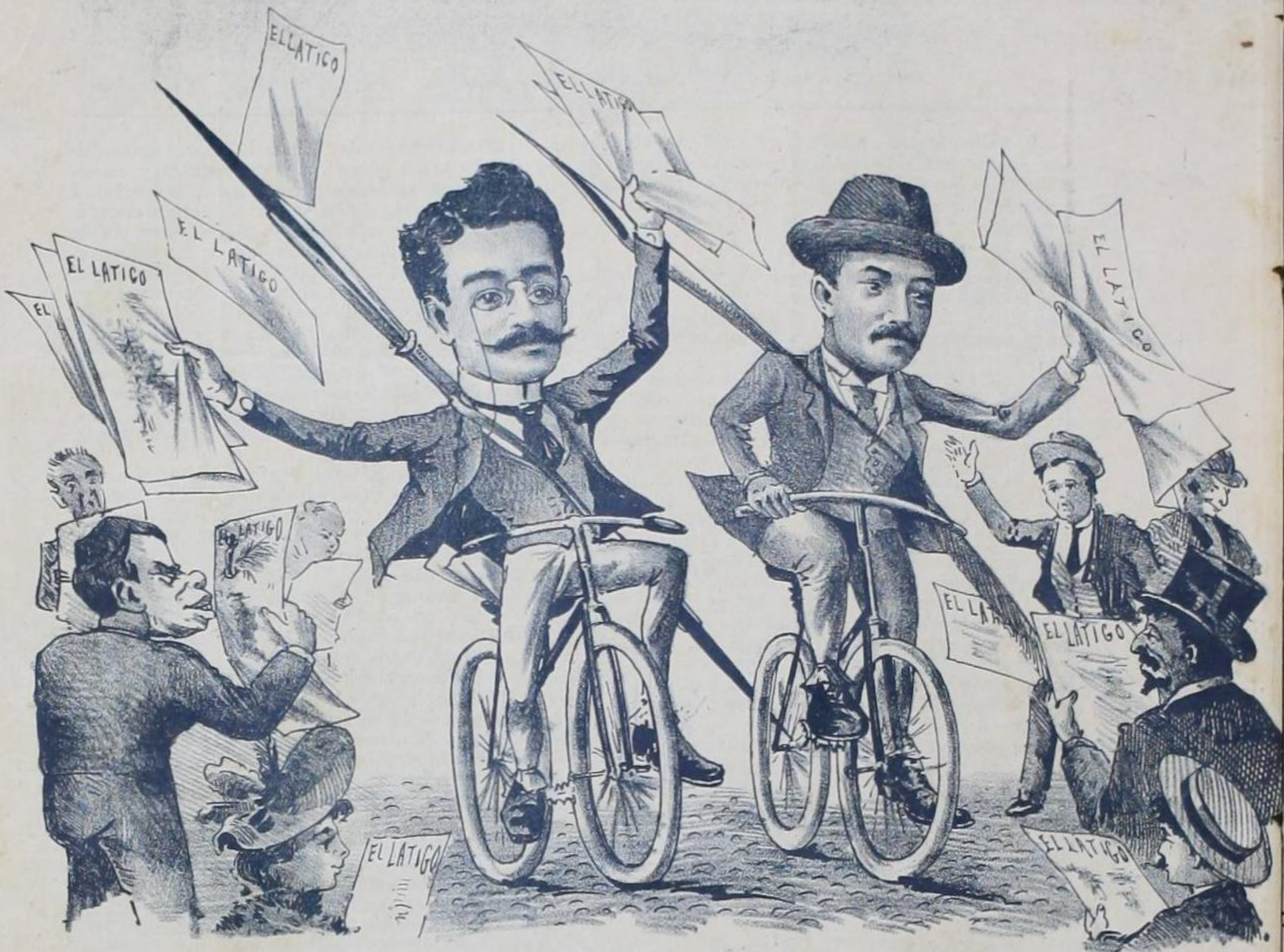
DICEN QUE NO HAY SERIEDAD — CABALGANDO EN BICICLETA PUES LA REDACCION DE "EL LATIGO" SALUDA MUY SERIAMENTE A SUS COLEGAS DE PRENSA.