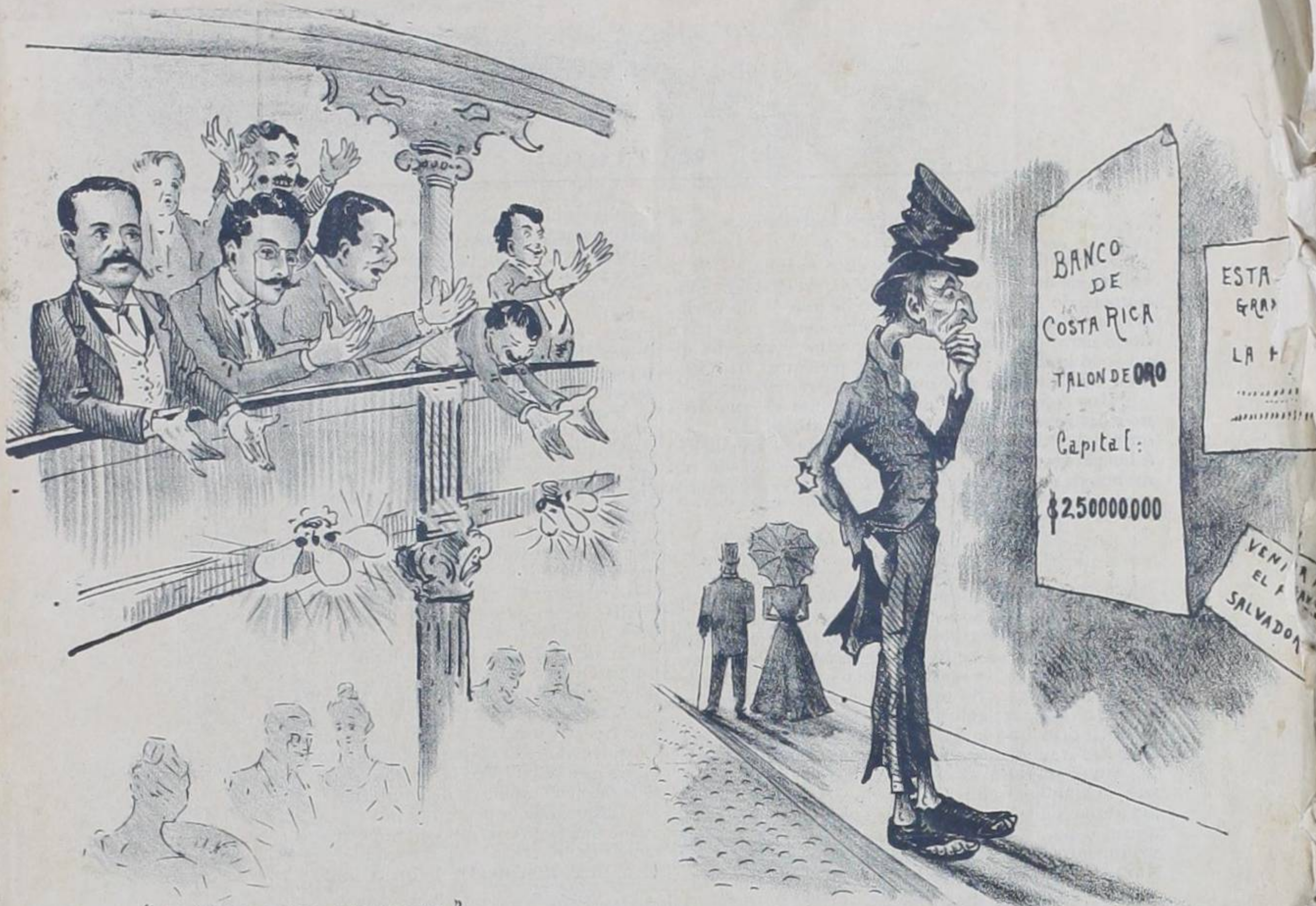
"LA VENGANSA DE POETA" APLAUDIO EL PUBLICO TANTO, QUE EL GALLINERO FRENETICO CASI SE VIENE ABAJO.