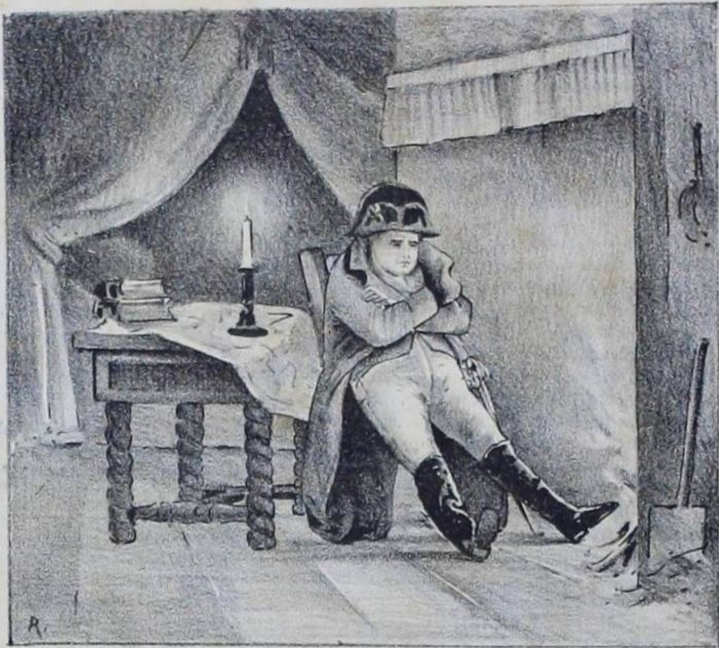
EL PENSAMIENTO CAMPAÑA DE FRANCIA. (POR HAFRET)

CON UN RELOJ DE LA CASA DE VICENTE PALAVICINI SIEMPRE SE LLEGA A TIEMPO.