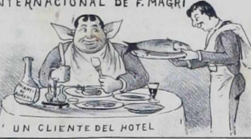
UN CLIENTE DEL HOTEL

EL HOTEL DE SAN JOSE DONDE SE ALMUERZA Y SE COME MEJOR CENAS A LA CARTA HABITACIONES CANTINA SURTIDA