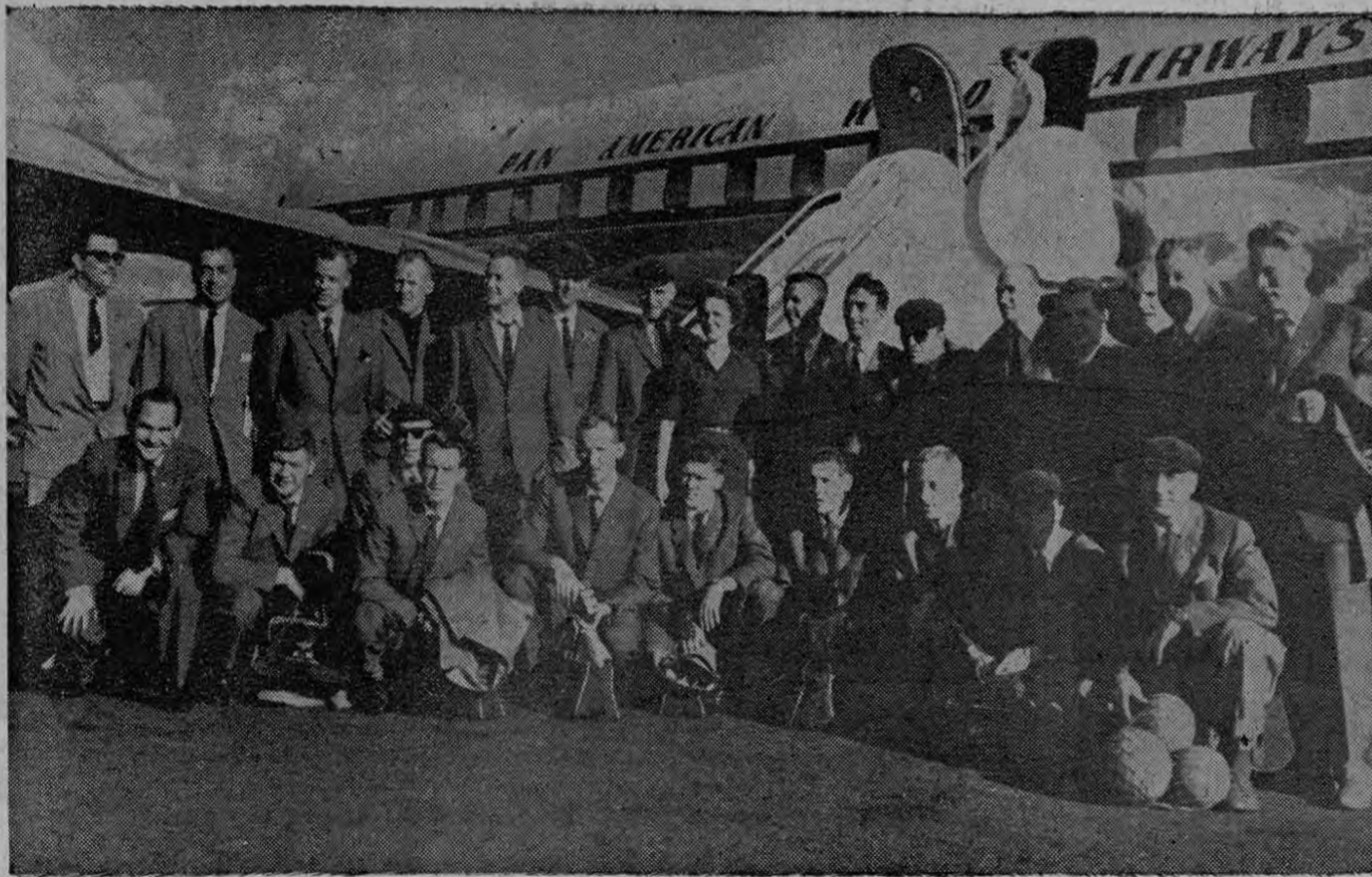
La Delegación Deportiva del Helsingfors de Suecia, posa para nuestro fotógrafo Artavia, a su llegada al Aeropuerto El Coco, ayer tarde

A las 4 de la tarde de ayer vía Pan American, llegó al aeródromo de El Coco la Delegación deportiva del Helsingfors de Suecia, procedente de Medellín, (Colombia), donde habían actuado el día anterior, empatando a dos goles con el equipo Independiente de aquella ciudad.