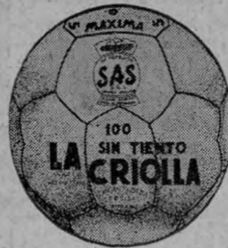
LA CRIOLLA (Argentina)