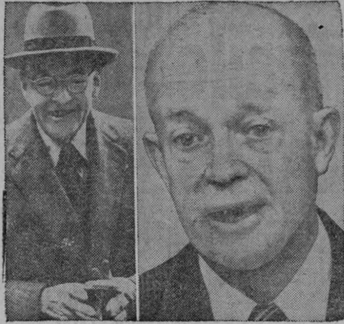
El Presidente Eisenhower (izquierda), durante su última conferencia de prensa en Washington, le dijo a los periodistas que el Secretario de Estado John Foster Dulles es el funcionario más valioso en asuntos de relaciones extranjeras que él jamás haya conocido. El Presidente hizo la observación en los momentos en que Dulles (izquierda) ingresaba al Hospital Walter Reed para una operación de la hernia. El primer mandatario dijo que Dulles estará alejado de sus funciones por unas cuantas semanas.

"La agresión anticomunista será funesta para la estabilidad del gobierno constitucional".