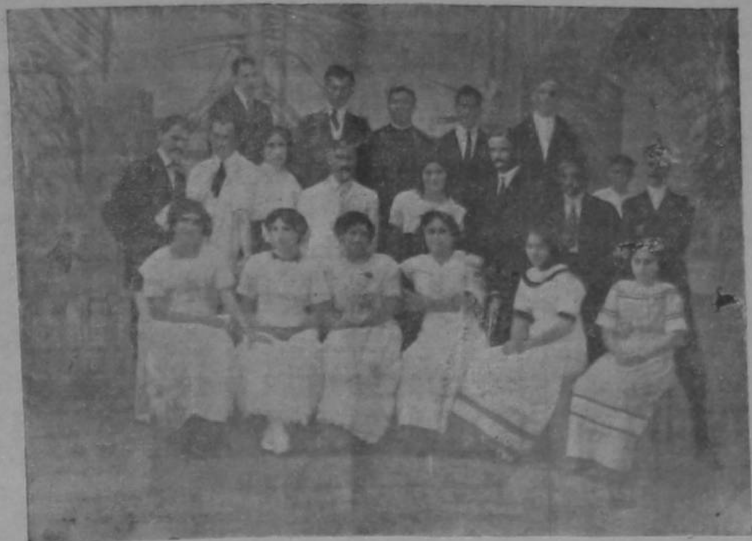
Presidente de la Junta de Educación y Maestros de Liberia

LA REPUBLICA dedica una sección del periódico á las Provincias y pueblos del país, con el objeto de que tengan oportunidad de tratar los asuntos de interés público. A fin de dar cabida al mayor número de correspondencias, recomendamos que las cuestiones se expongan en la forma más sucinta que sea posible