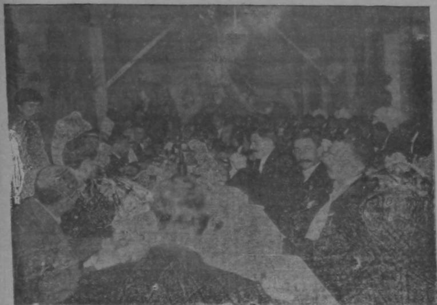
Banquete organizado por la Colonia Italiana