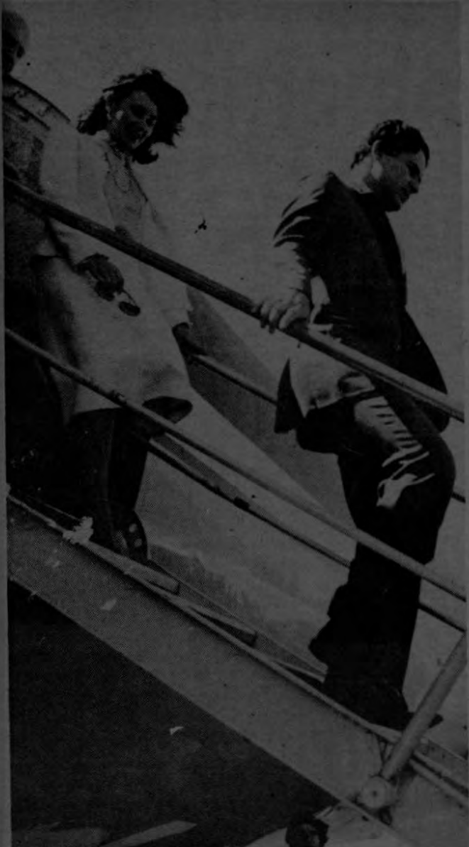
El presidente Aristides Royo de Panamá, llegó ayer a nuestro país para una corta visita de 48 horas, durante la cual se firmarán convenios de gran importancia para Costa Rica y Panamá.