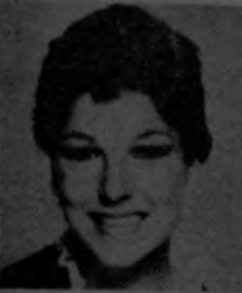
TATUM: Con la ropa puesta.

¿Qué hay del rumor de que Tatum O'Neal realmente se presentó desnuda en la película que está haciendo con Richard Burton? Puede ser cierto eso?