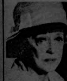
DAVIS: Se culpa

La actriz favorita de Bette fue y es Greta Garbo. Ninguno de sus cuatro matrimonios fue particularmente feliz y ella se culpa a sí misma principalmente por elegir esposos que no podían enfrentarse a su fama.