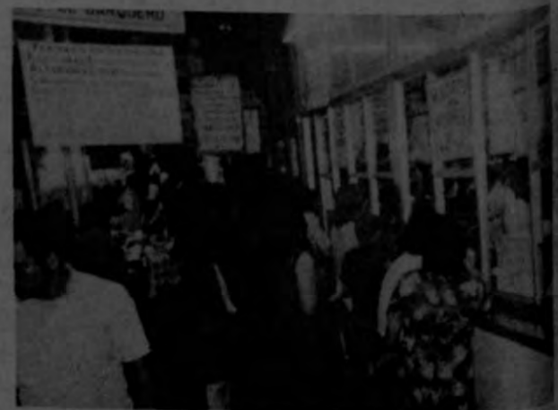
Los consumidores acudieron ayer a adquirir sus alimentos como de costumbre.