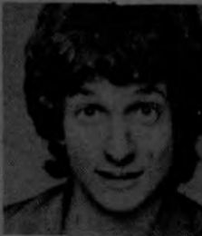
PALILLO: "Skatetown USA"

HOLLYWOOD está entrando en la onda del disco-esquí. Columbia Pictures está por presentar "Skatetown USA" La estelizarán Scott Baio y Ron Palillo. Y en United Artists todos están muy complacidos por "Roller Boogie" estelizarada por Linda Blair.