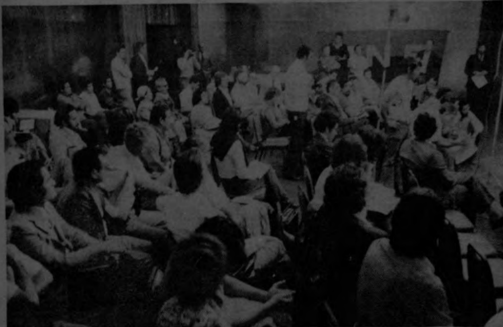
Periodistas de varios países del continente se hicieron presentes durante la conferencia de prensa que se dio ayer con motivo de la finalización de la Conferencia Internacional, sobre el caso de El Salvador en el proceso de democratización. (Lainez).

Además, se planteó la necesidad de que ante la inquietud del tipo de la sociedad para la que se quiere educar, se debe que esta deberá ser una sociedad nacional con un modelo ético, moral, propio y auténtico. Al respecto una ponencia sugirió que se eduque para una sociedad en que se observe equilibrio entre el hogar, la escuela y la iglesia.