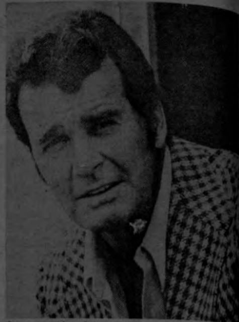
Otra versión del accidente e incidente que sufrió el actor James Garner, se conoció por parte del agresor. Según ésta, el protagonista de la serie "Archivo Confidencial" fue el causante del incidente.