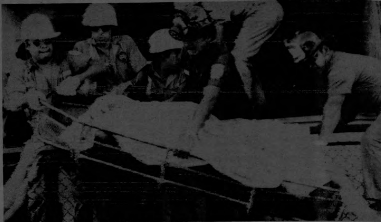
Guatemala.— Un bombero y un trabajador de la Cruz Roja colocan uno de los 39 cadáveres en una camilla en la embajada de España. Dos personas, incluyendo al embajador español Cajal y López, sobrevivieron al ataque de la policía y el incendio resultante causado por una bomba Molotov.