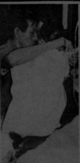
Ayer no hubo problemas en el comercio para conseguir artículos básicos. (L. Castillo)

Esta dramática escena de ruina y destrucción corresponde a lo que quedó de la Embajada de España en Guatemala, donde en un acto incalificable y repudiado por todas las naciones del mundo, el ejército provocó un incendio y signó una matanza de campesinos.