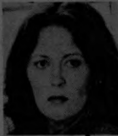
DUNAWAY: Excelente propina

El gran agradecimiento: Algunas estrellas de Hollywood son muy generosas al dejar propina. Tomemos por ejemplo a Faye Dunaway. Hemos oído que sin ningún escándalo, dejó una extraordinaria propina en el Stage Deli ese famoso restaurante en Manhattan. Con una notita agradeciendo al mesero por su extrema cortesía, dejó una pequeña caja con un diamante posiblemente valuado en 7 50 dólares.