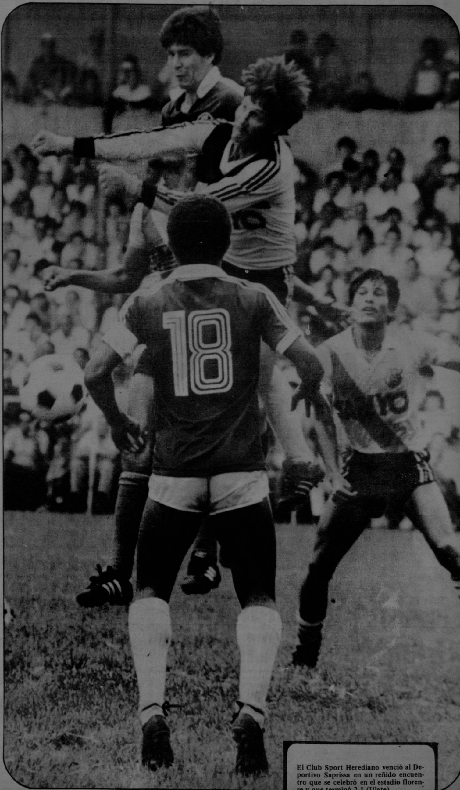
El Club Sport Herediano venció al Deportivo Saprissa en un reñido encuentro que se celebró en el estadio florense y que terminó 2-1 (Ulate).