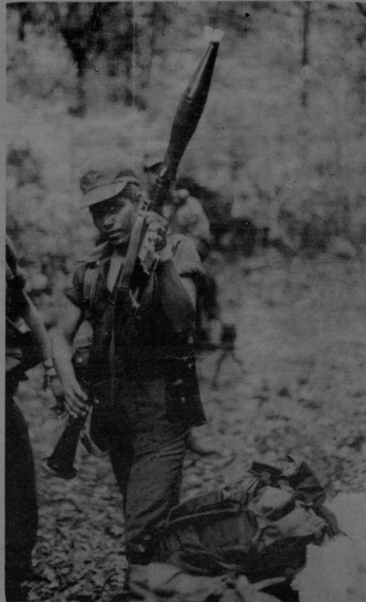
Danto fue uno de los portadores de los RPG-7 transportados por las tropas rebeldes durante varios días y kilómetros en acciones de hostigamiento. Se anuncia que la lucha será trasladada de la montaña a las ciudades..

"El Viejo", nombre de guerra de uno de los guerrilleros de más edad, afirma que "el personal de estas tropas tiene formación idónea para el grado de comandante y cualquiera de sus miembros puede armar y desarmar desde una pistola hasta una ametralladora e inclusive hasta accionar minas".