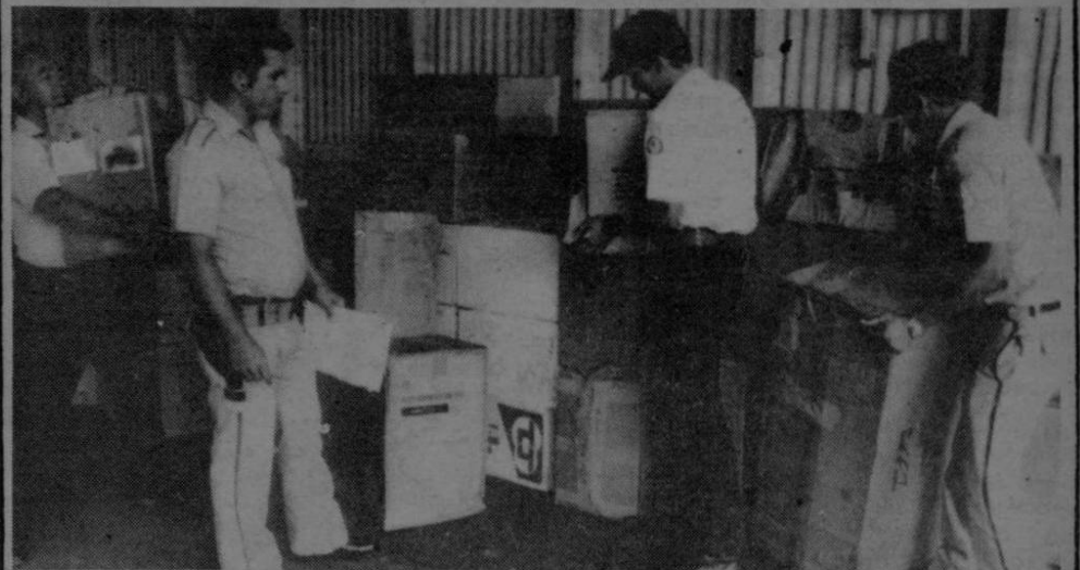
En "Base 2", Aeropuerto Internacional Juan Santamaría, sección aérea del Gobierno, siguió ayer el despacho por aire de ayudas para los damnificados de los terremotos de Pérez Zeledón. (Castillo).