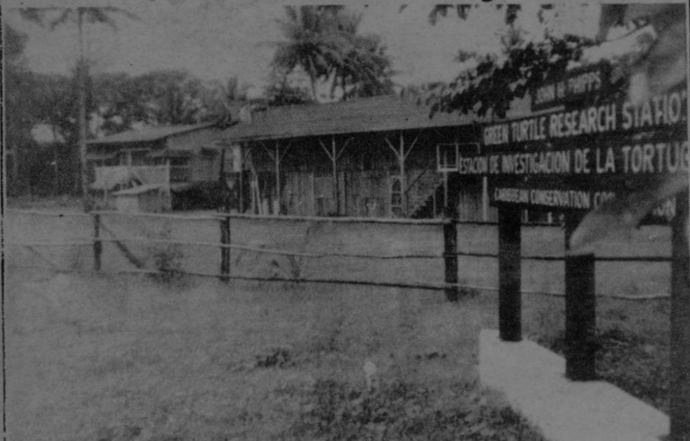
El próximo mes llegan al campamento de "Casa Verde", en Tortuguero, que maneja la Caribbean Conservation Corporation varios científicos y estudiantes extranjeros que realizarán aquí sus prácticas en biología marina y estudio de la tortuga verde