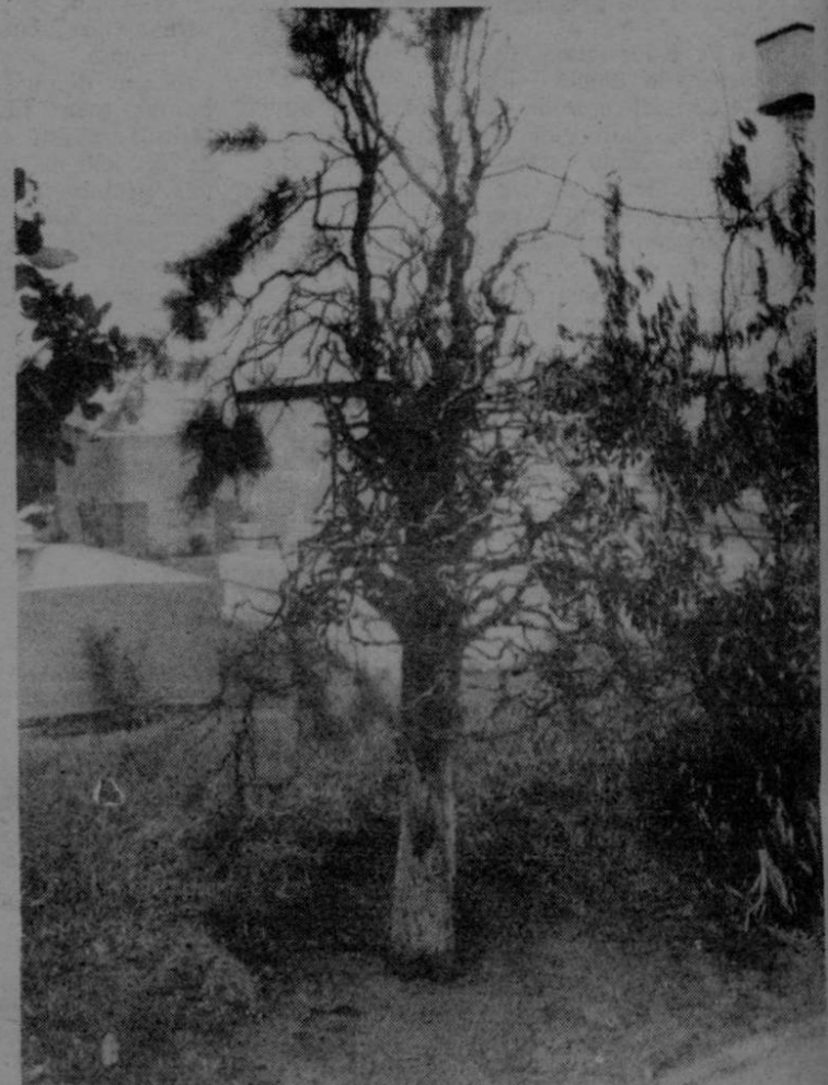
Arbol de ciprés ornamental que fue quemado esta madrugada en el Cementerio de Obreros. Los vándalos hicieron fuego al pie y chamuscaron sus ramas.