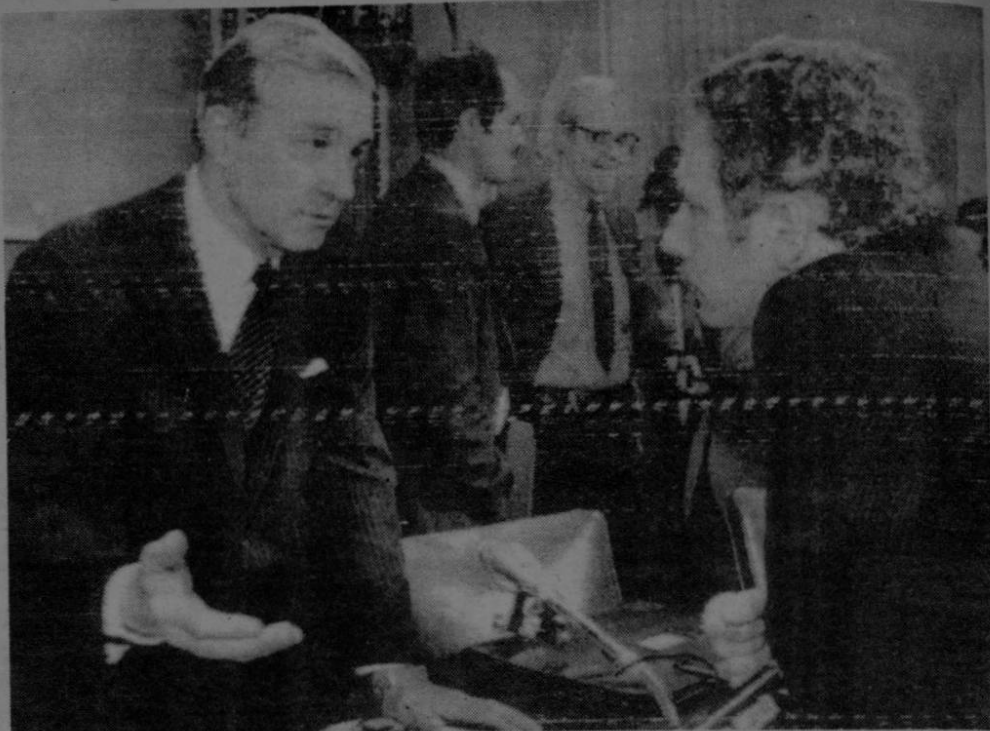
A la izquierda el senador Percy Charles que dice que Costa Rica por ser víctima del terrorismo debe pensar cuidadosamente en la política seguida de no tener ejército.

"Pensamos que Costa Rica ha estado en contacto estrecho con los Estados Unidos, pero hasta ahora no hemos recibido ninguna petición oficial de ayuda militar", agregó.