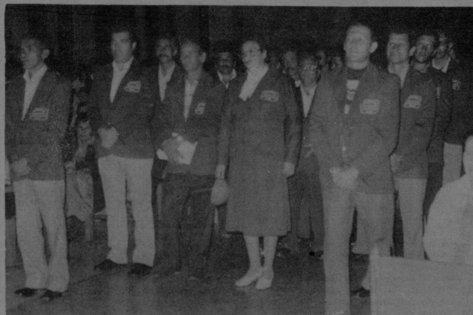
Hermanidad de Jesús Nazareno de Cartago en la celebración de sus 65 años.

Por otra parte dijo que muchas de las tierras de estas reservas biológicas que en otras épocas eran aprovechadas para la producción, y que son bastante aptas, ahora no lo son, con el consecuente perjuicio pa-