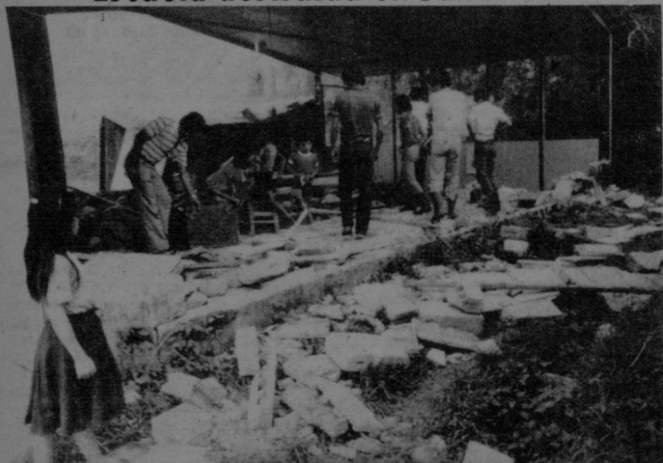
Aspecto de una de las tres escuelas destruidas por el terremoto en el valle de El General. (Castillo)