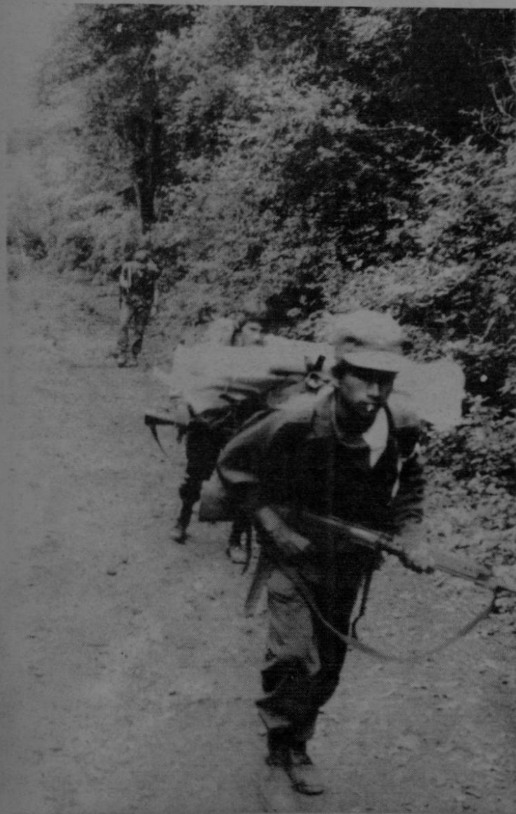
Algunos de estos guerrilleros están en armas por las penalidades que han sufrido en su patria, donde han sido amenazados de muerte inclusive.

"También me duele que se disfrazen de Sandino, no está dentro del derecho que un ser humano muerto hace muchos años esté siendo sacado todos los días para burlarse de él e involucrarlo en el sistema comunista con el cual no tuvo nada que ver. El General era democrático, luchó contra los ladrones y nosotros también lo hacemos hoy día".