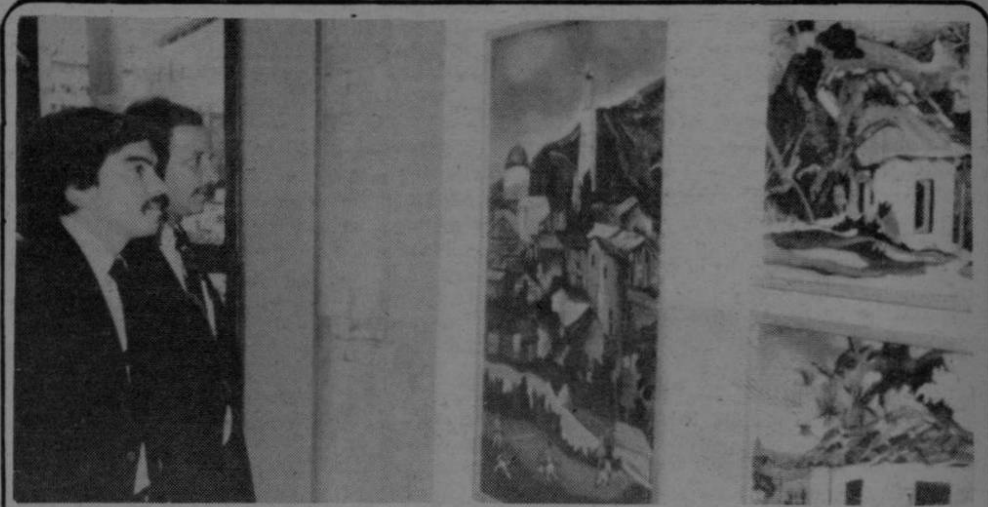
La Asociación de Profesores de Segunda Enseñanza (APSE) inició en el Banco Nacional una exposición de pinturas sus asociados. La actividad durará varios días como parte de la actividad gremial de esa organización.

El segundo Vicepresidente y coordinador del Consejo de Seguridad del Estado expresó al terminar las declaraciones que "el Consejo de Seguridad y lo que es lo mismo, el Gobierno, garantiza seguridad y reitera a todos los costarricenses que cada uno debe ser un vigilante de nuestro sistema democrático".