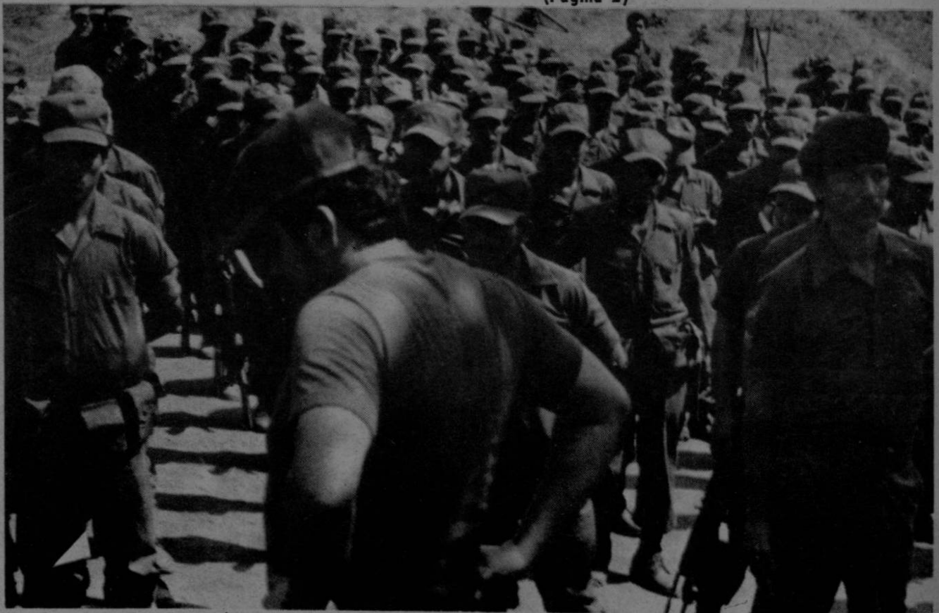
Hombres de Fuerza Democrática Nicaragüense, FDN, que luchan en la parte norte de Nicaragua cuando escuchaban instrucciones sobre la nueva ofensiva que mantienen en la zona. Uno de ellos, descendiente de Sandino, habló a nuestro reportero José Luis Fuentes. (Pág. 8)