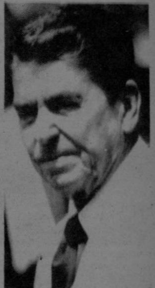
El presidente Ronald Reagan dijo estar dispuesto a continuar tras el diálogo con la guerrilla salvadoreña.

Bancos con ¢ 2.200 millones para promover exportaciones