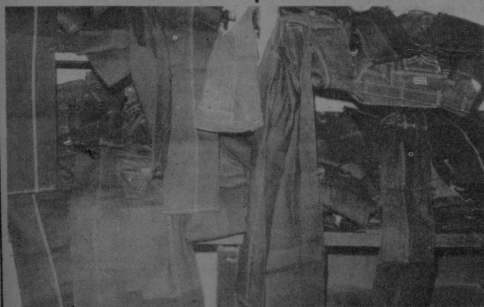
Agentes de la Unidad Preventiva del Delito (UPD) mostraron ayer un lote de pantalones "jeans" que decomisaron en una bodega clandestina cerca del Bo. Carit de esta ciudad. La Policía no brindó detalles sobre la identidad de los detenidos. (Joyel)