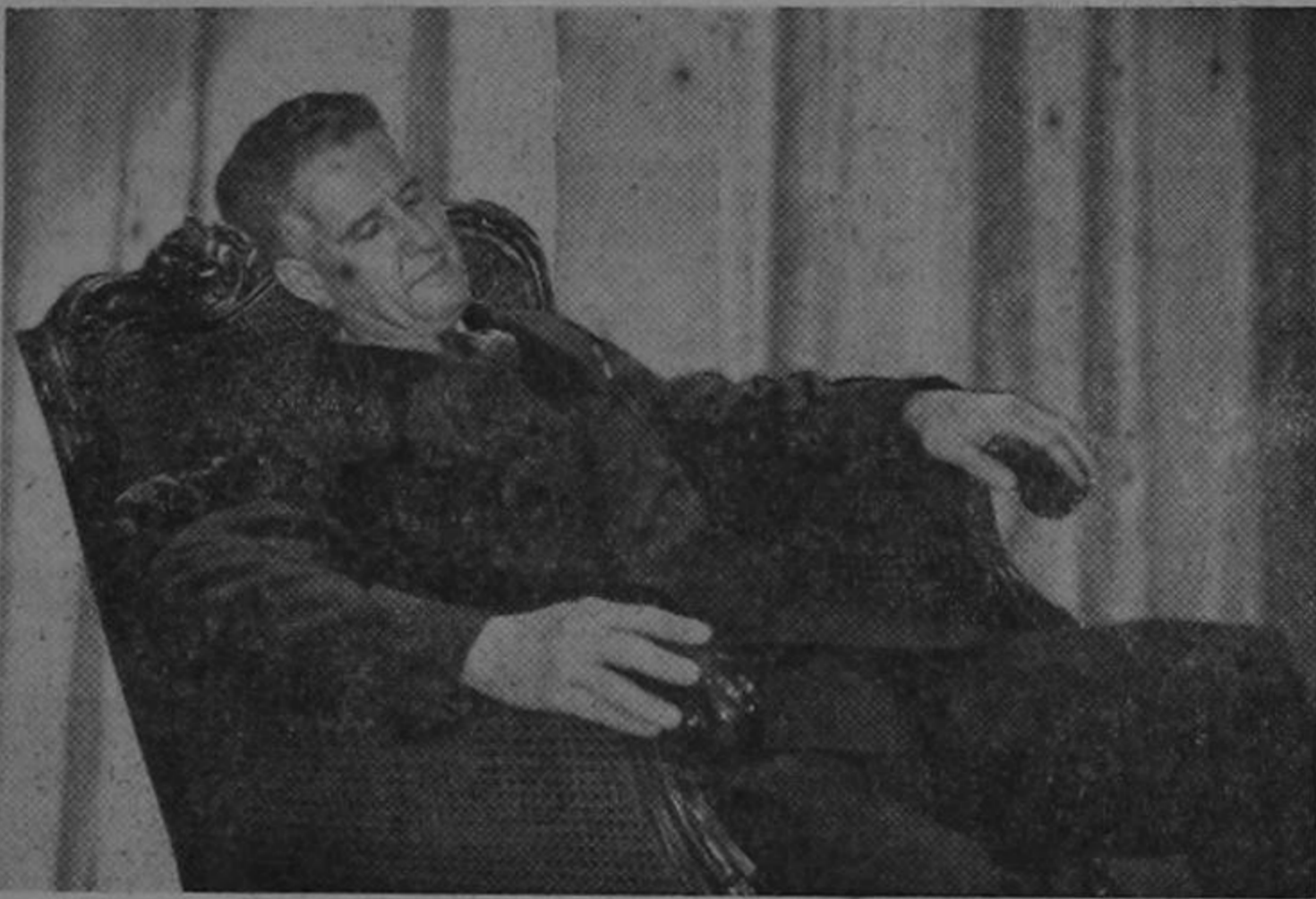
ES MEJOR QUE NO SE DESPIERTE...

Nuestra cámara sorprendió al señor Ministro Chaverri profundamente dormido. Mientras tanto cientos de alumnos no encuentran campo en las escuelas, hay baratil los de colegios particulares en don de regalan los títulos y nadie se opone a las salvajes novatadas con que son maltratados los alumnos de los primeros años.