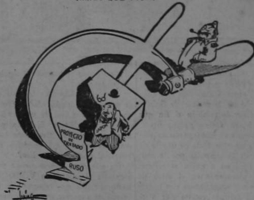
DEL DIARIO "THE PROVIDENCE EVENING BULLETIN", DE PROVIDENCE, RHODE ISLAND, E.U.A.

Esta caricatura recientemente apareció en el periódico "The Providence Evening Bulletin", publicado en Providence, Rhode Island, en los Estados Unidos de América. Imposibilitado para moverse a causa del martillo comunista en su espalda, Japón es presentado con el Proyecto de Tratado Ruso atado a la punta más aguda de la hoz comunista manejada por Stalin.