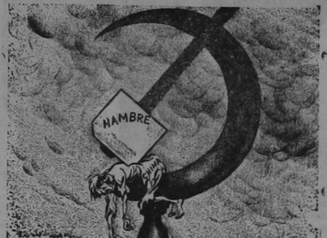
DEL DIARIO "THE INDIANAPOLIS NEWS", DE INDIANAPOLIS, INDIANA, E. U. A.

"EXTENUACION". Esta caricatura, recientemente apareció en el periódico "The Indianapolis News" publicado en Indianapolis, Indiana, Estados Unidos. China apareció extenuada por el hambre, pensada entre la hoz y el martillo comunistas.