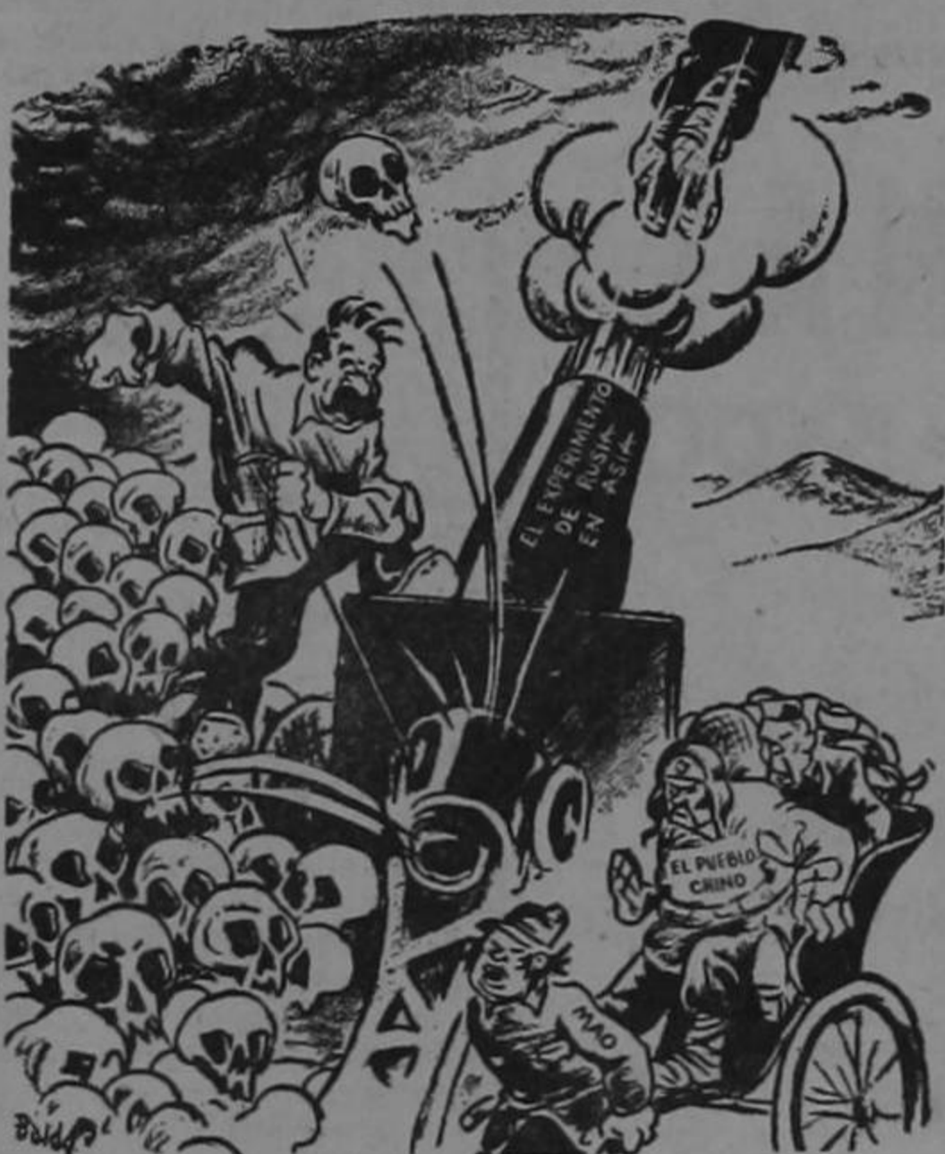
DEL DIARIO "THE ATLANTA CONSTITUTION", DE ATLANTA, E.U.A.

Esta caricatura apareció recientemente en "The Atlanta Constitution", diario publicado en Atlanta, Georgia, U.S.A. Stalin está enseñando a Mao Tse-tung, líder comunista chino, a disparar el cañón y lo apura para que jale más municiones, no obstante que a su lado se encuentran miles de calaveras chinas que han sido sacrificadas en el experimento que Rusia está haciendo en el Asia.