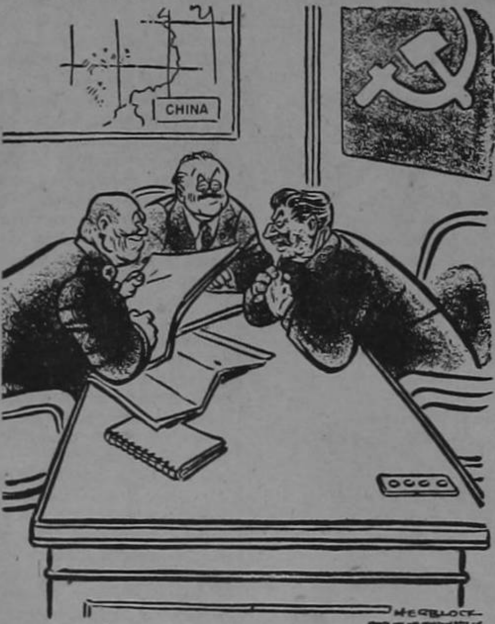
DEL DIARIO "THE WASHINGTON POST," DE WASHINGTON, E. U. S.

"SON QUINIENTOS MILLONES... QUE PODEMOS SACRIFICAR"