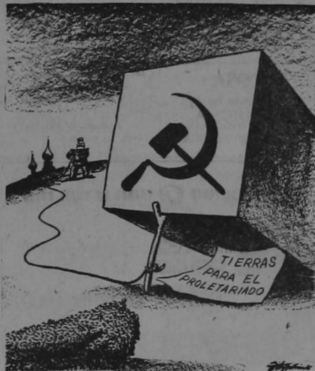
DEL DIARIO "THE ST. LOUIS POST-DISPATCH" DE ST. LOUIS, MISSOURI, E. U. A.

Esta caricatura fué publicada recientemente por el "The St. Louis Post Dispatch" un diario de San Luis, Missouri, en los Estados Unidos. El lider comunista aparece al fondo, esperando soltar la trampa sobre los pueblos de Asia a los cuales los soviéticos han prometido "tierras para el proletariado..." ¡Una farsa más del comunismo internacional!