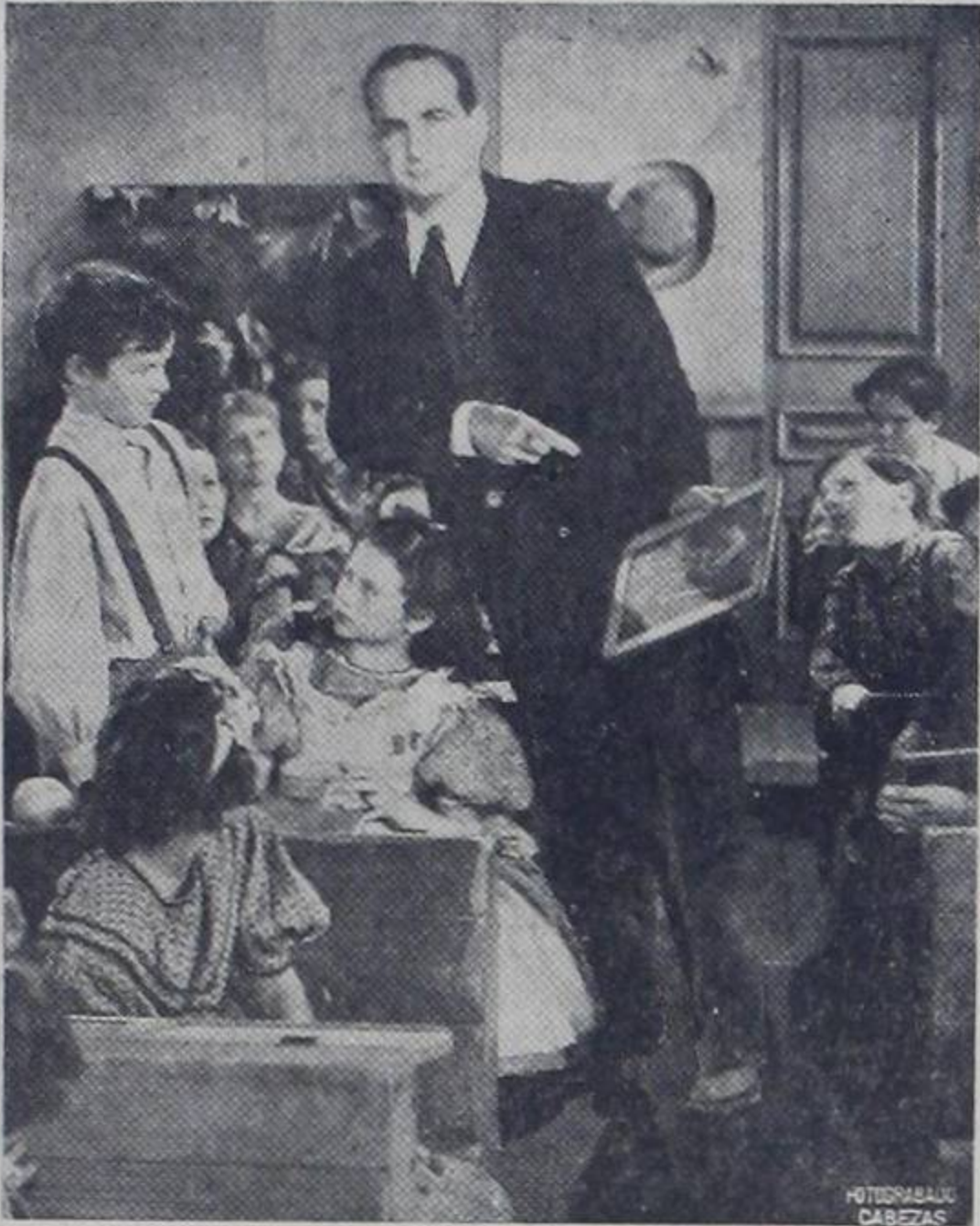
Figures: Niños, no hagan desorden ni se peleen por colaborar. Todos tendrán oportunidad de hacerlo. Unos desde la curul y otros de la llanura (lloriqueos). Lo último es lo malo don Pepe!!!

San José, Costa Rica. — Director-Gerente: Julio C. Suñol — Teléfono 6483 — 25 de Abril de 1953 — N° 673