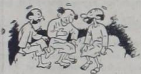
—Dice el doctor Escalante Pradilla que la Junta de

Protección Social miró en forma despreocupada el hecho de q' se esfumara un millón cillo de colones. Se le critica por no haber actuado con toda energía.