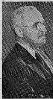
HARRY S. TRUMAN Presidente de los Estados Unidos de América

Hace ciento setenta y cinco años el Congreso Continental declaró la independencia de los Estados Unidos de América.