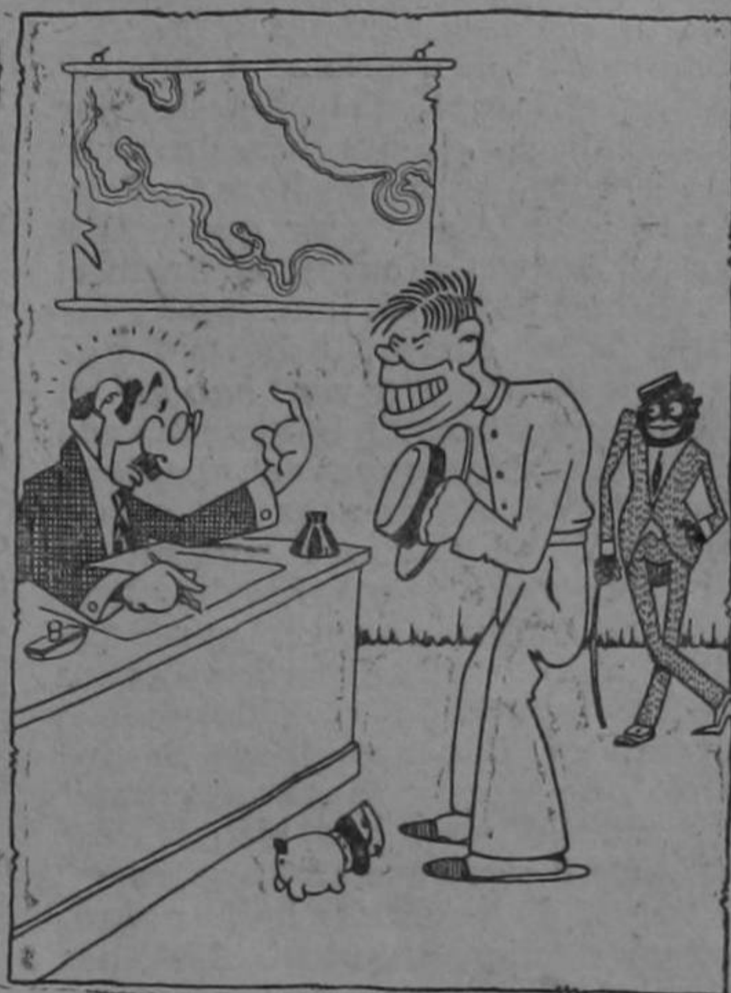
Clisé de Baixench

Cuando la patria se queja por haber vientos guerreros, hay, entonces, extranjeros que le zafan la pelleja.