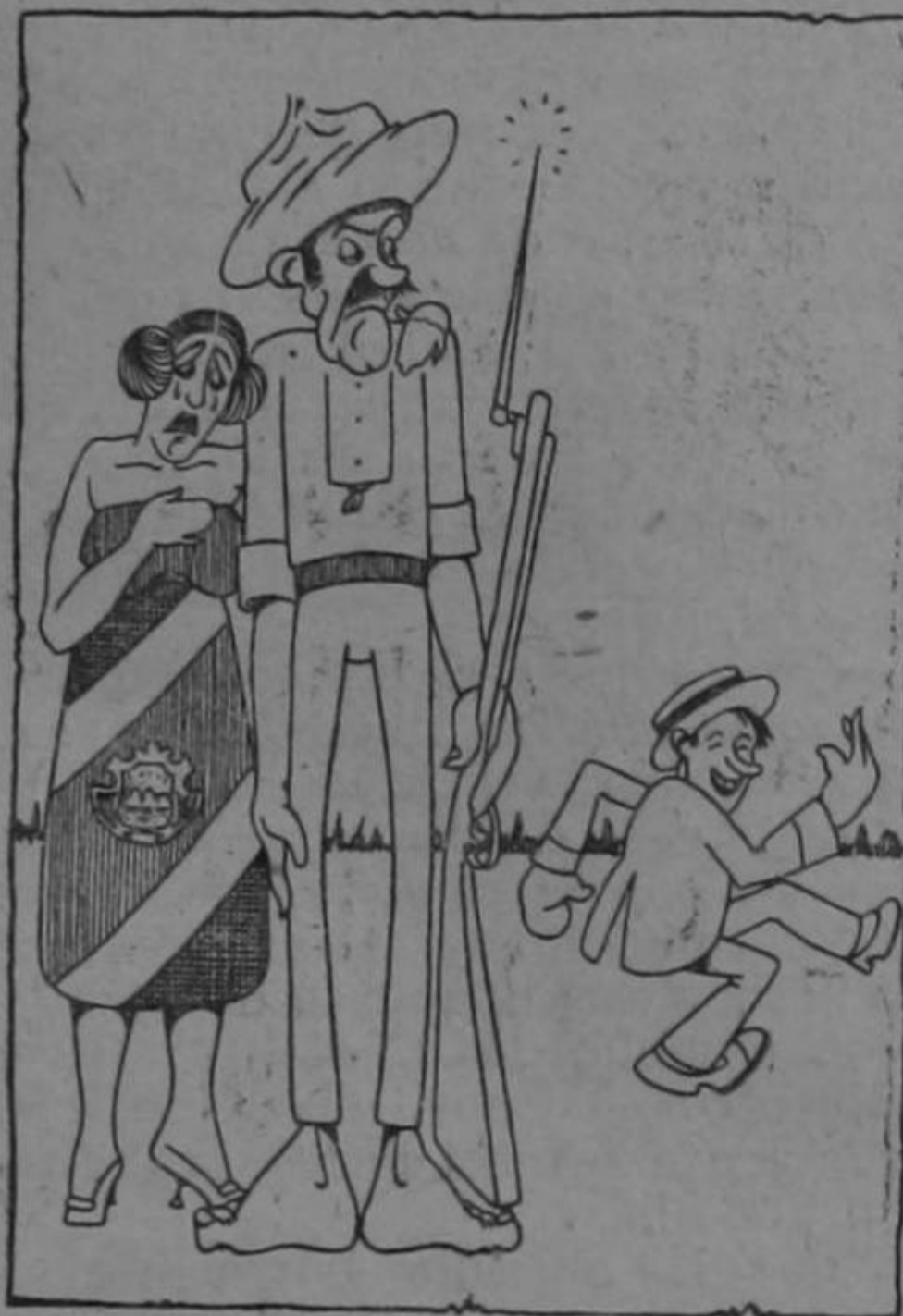
Dibujo de Solano

Cuando la patria se queja por haber vientos guerreros, hay, entonces, extranjeros que le zafan la pelleja.