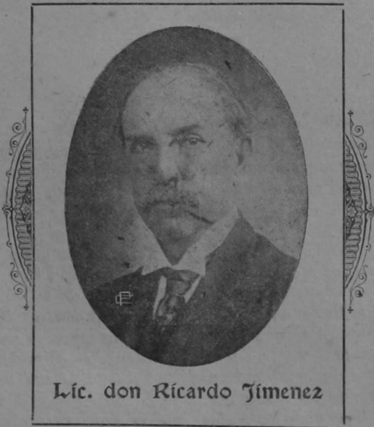
Lic. don Ricardo Jiménez

¡Ya se aproxima el momento de que todo hombre sensato elija su candidato para el nuevo advenimiento! Y aunque hay sobrado elemento que salió con paso tardo, dentro de él no hay un bastardo, por lo cual, según yo creo, vencerá en este torneo nuestro insigne don Ricardo!