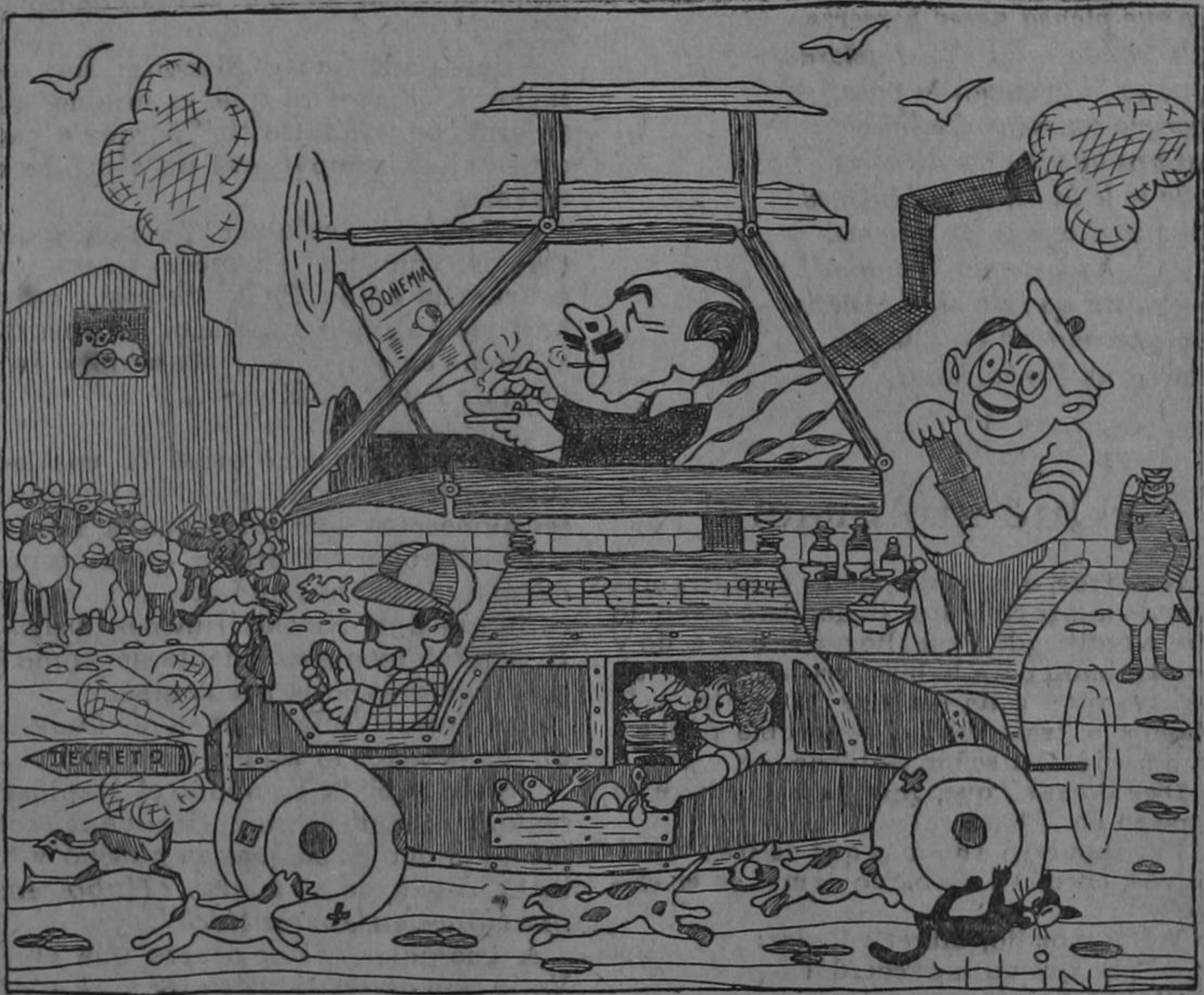
Dibujo de Hine