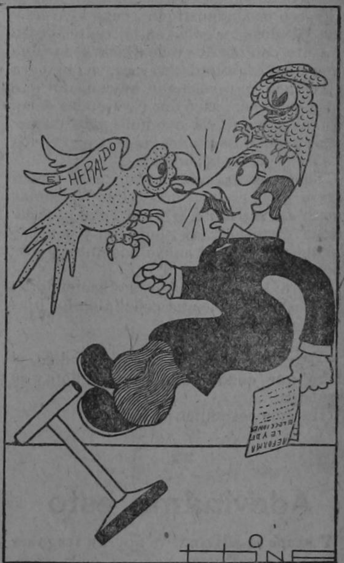
Clisé de Baixench

La infatigable lorita, con la lechuza molesta, porque nunca de la testa de su víctima se quita de tal manera se irrita,