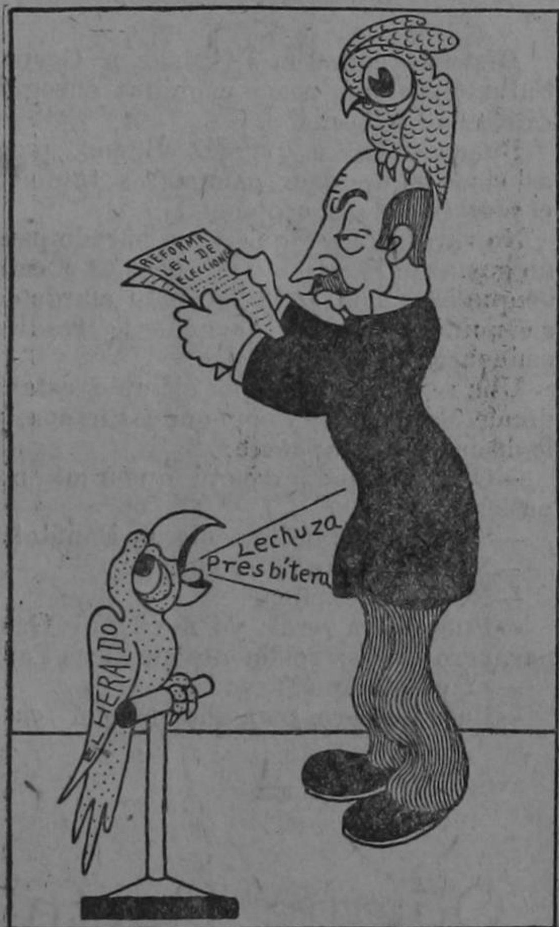
Dibujo de Hine